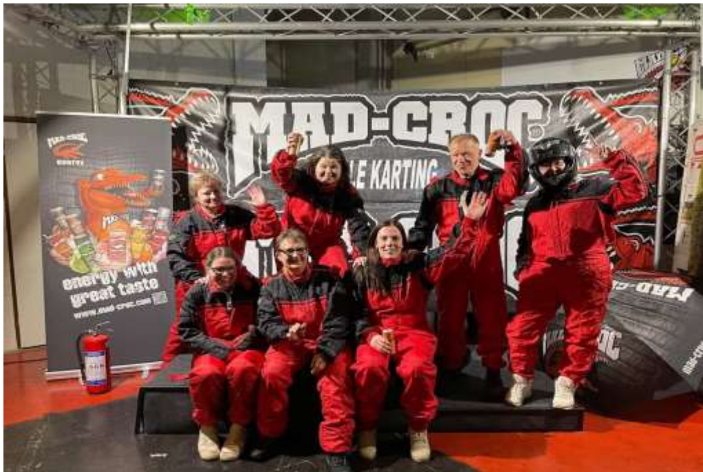
KUVA 2: Kotihoidon itäisen alueen tiimi testaili työssä kertyneitä ajotaitojaan tyköpäivän merkeissä loppuvuodesta 2021.

Tämän lisäksi noin 10 prosenttia esimiehistä on ilmoittanut käyneensä vuoden 2021 kehityskeskusteluja työntekijän kanssa alkuvuodesta 2022.