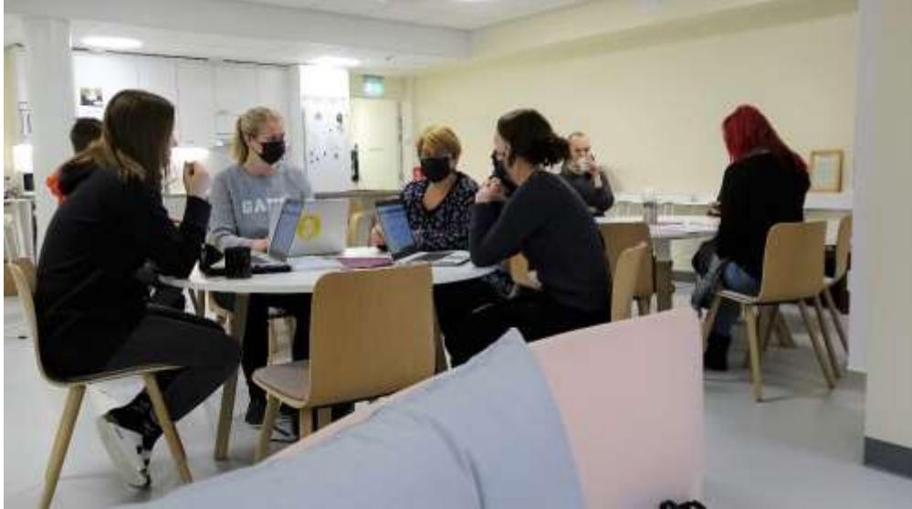
KUVA 4: Osa Harjurinteen koulun ja Loviisan lukion yli sadan henkilön henkilökunnasta tauolla.