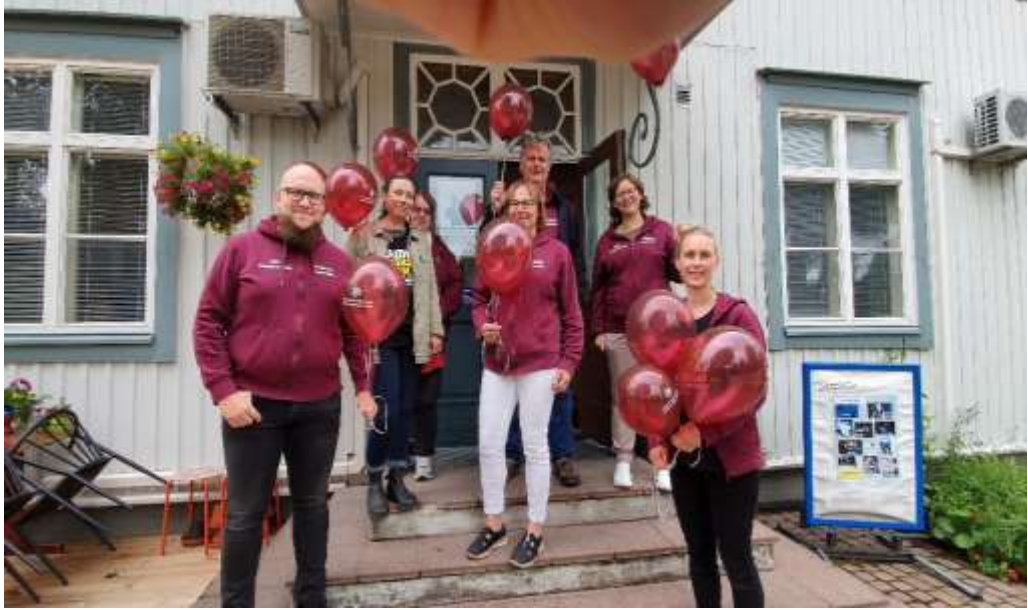
KUVA 3: Kansalaisopiston henkilökunnan markkinointitempaus 18.8.2021 Pyhtään kulttuuritalolla.