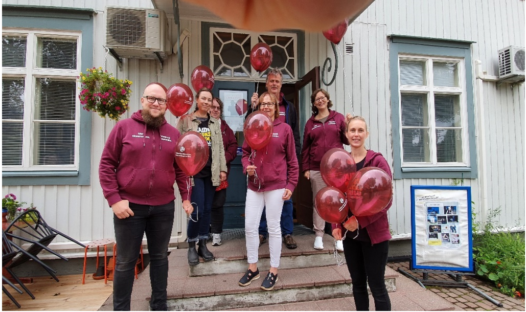
KUVA 3: Kansalaisopiston henkilökunnan markkinointitempaus 18.8.2021 Pyhtään kulttuuritalolla.