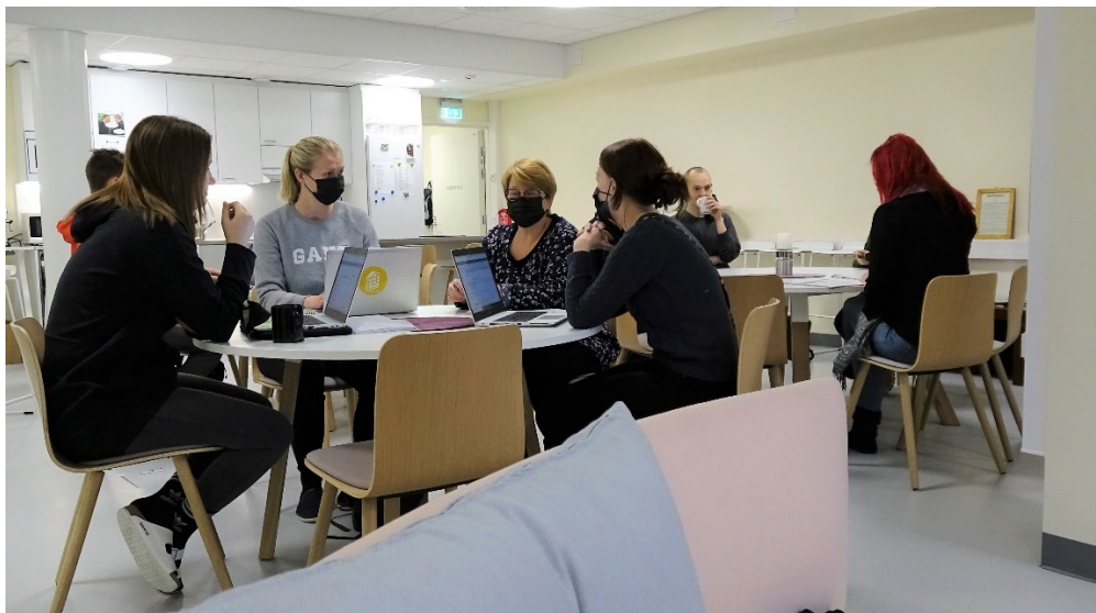
KUVA 4: Osa Harjurinteen koulun ja Loviisan lukion yli sadan henkilön henkilökunnasta tauolla.