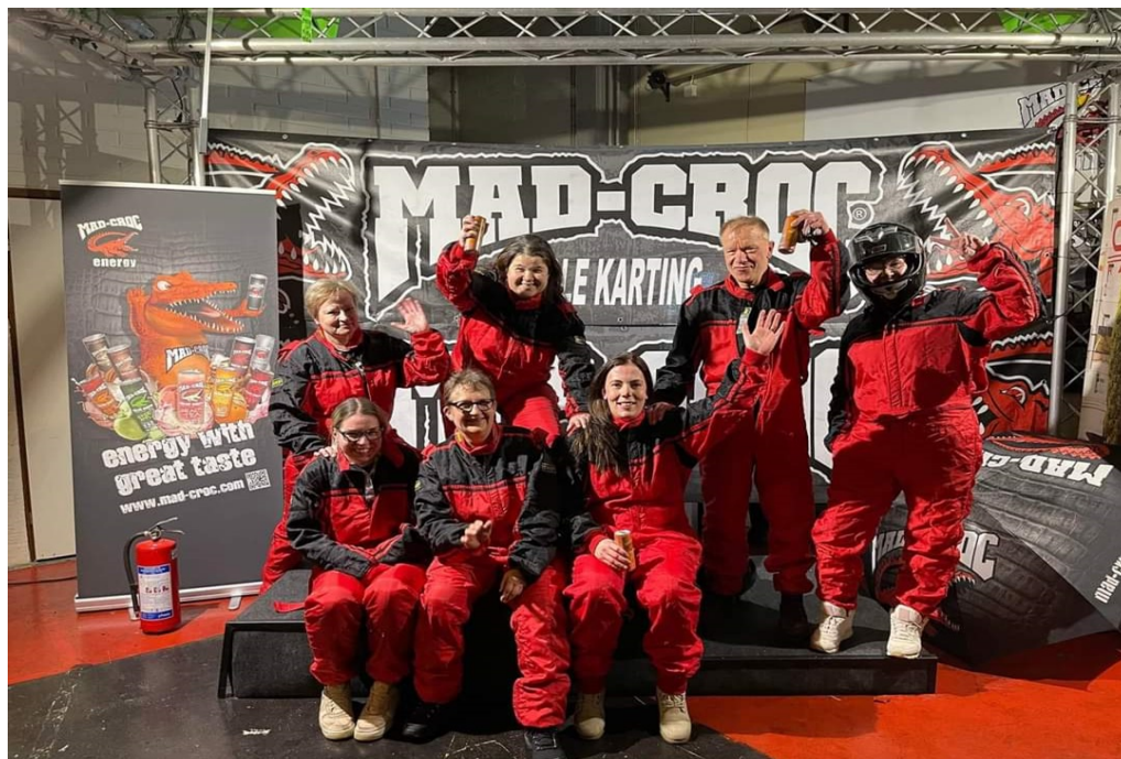
KUVA 2: Kotihoidon itäisen alueen tiimi testaili työssä kertyneitä ajotaitojaan tyköpävän merkeissä loppuvuodesta 2021.

Tämän lisäksi noin 10 prosenttia esimiehistä on ilmoittanut käyneensä vuoden 2021 kehityskeskusteluja työntekijän kanssa alkuvuodesta 2022.