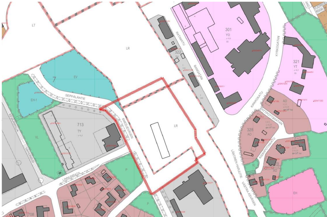
Kuva 3 Ote alueen kaavoja yhdistelevästä ajantasakaavasta

Kaava-alueen länsiosalla Seppäläntien Linnunradan pohjoispuolelle suunnitellulla osalla oleva kaava 434-AM7-18 on vahvistettu 3.2.1988. Asemakaavassa v. 1962 alue on ollut rata-aluetta (LR) ja tieliikennealuetta (LT).