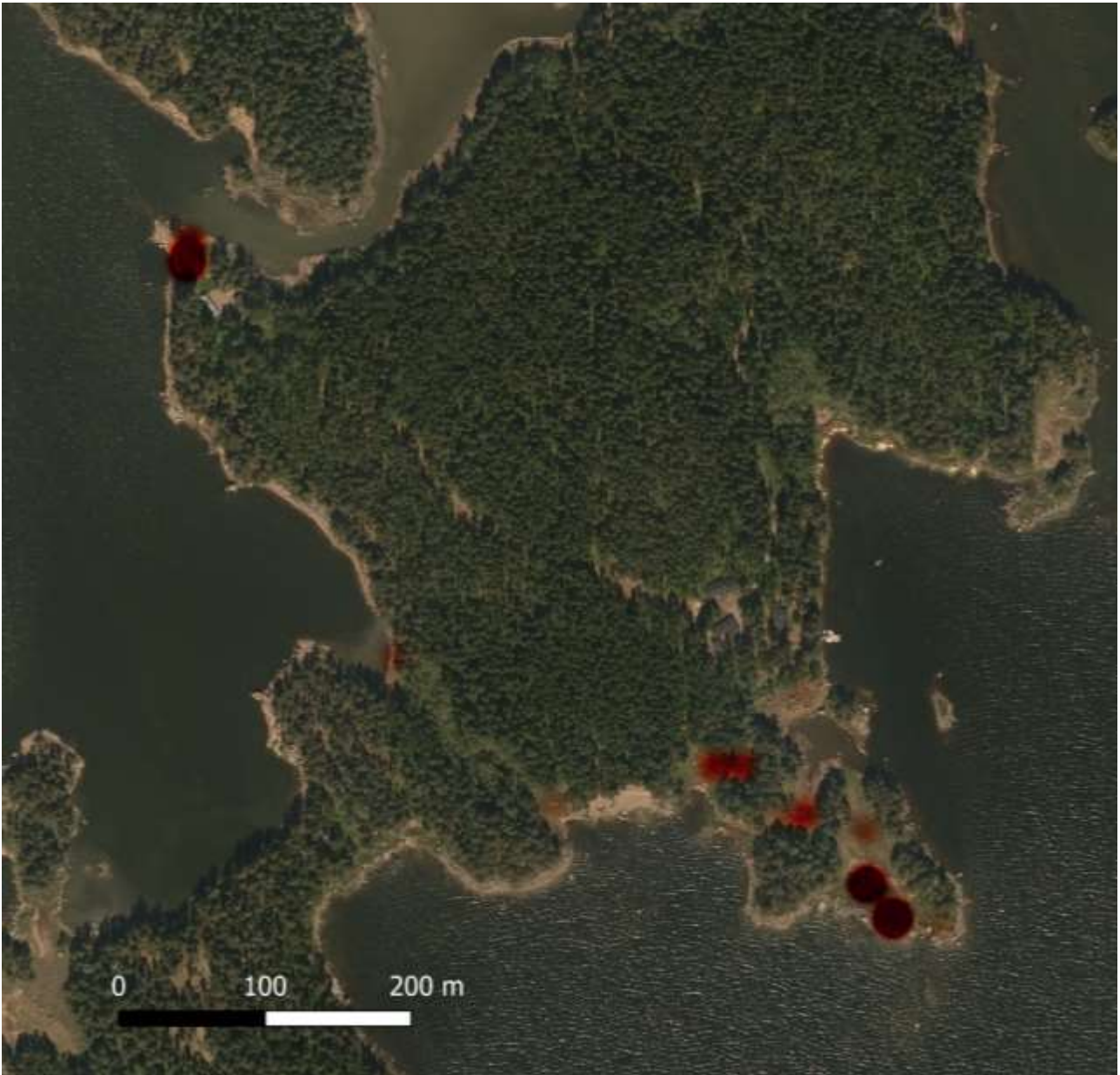
Kuva 3. Heat map tyräkkitarhakääriäisen kudelmien runsaudesta Tavistholmenin etelä- ja länsirannalla vuonna 2019. Runsausarvo on muodostettu laskelmalla kultakin osa-alueelta yhteen kudelmien kasvikohtainen runsausluokka (0 = ei kudelmia, 1 = 1–10 kpl, 2 = 11–20 kpl, 3 = yli 20 kpl).