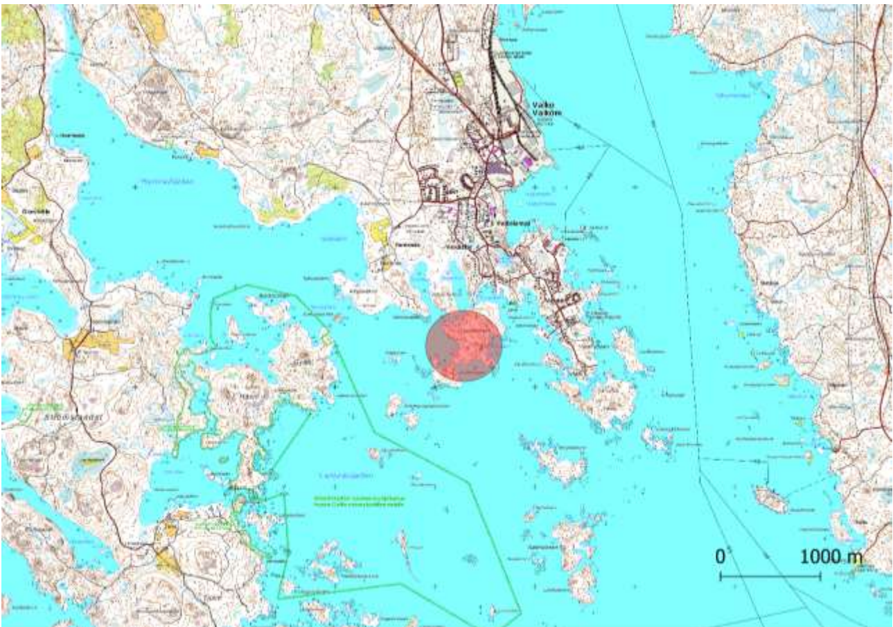
Kuva 1. Selvitysalueen sijainti. Pohjakartta: Maanmittauslaitoksen peruskartta 7/2019.

Tyräkkitarhakääriäinen ( Lobesia euphorbiana ) on Suomessa erittäin uhanalainen (EN) perhoslaji (Nupponen ym. 2019), jonka toukka elää tyräkeillä ( Euphorbia ). Suomessa lajin on todettu elävän ainoastaan rantatyräkillä ( Euphorbia palustris ). Tyräkkitarhakääriäisen levinneisyys noudattaa maassamme rantatyräkin levinneisyysaluetta, joka kattaa itäisen Suomenlahden ranta-alueen Porvoon Pellingistä itään.