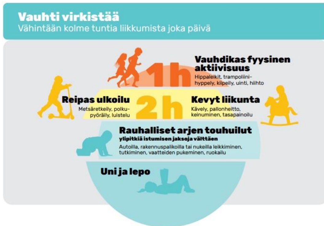
Kuva 1. Suositeltava fyysinen aktiivisuus koostuu päivän mittaan kuormittavuudeltaan erilaisista arjen touhuista.

Liikkuminen tukee alle kouluikäisen lapsen tervettä kasvua sekä kokonaisvaltaista kehitystä. Pienillä lapsilla liikkuminen ja liikunta on yhtä lailla inhimillinen tarve kuin syöminen ja nukkuminen. Lasten varhaisvuosien fyysisen aktiivisuuden suosituksien mukaan alle 8-vuotiaiden lasten päivään pitäisi sisältyä vähintään kolme tuntia liikuntaa. Se muodostuisi kevyestä liikunnasta ja reippaasta ulkoilusta sekä erittäin vauhdikkaasta fyysisestä aktiivisuudesta. Osa liikunnasta toteutuisi varhaiskasvatuksessa, osa kotona. Yli tunnin pituisia istumisjaksoja tulisi välttää ja lyhyitäkin paikallaanoloja tauottaa. Liikunta ja liikunnallinen lapsuus vähentävät terveyspalveluiden käyttöä ja niiden aiheuttamia kustannuksia. Liikunnasta onkin hyötyä paitsi yksilölle myös yhteiskunnalle. Suosituksissa korostetaan myös riittävää lepoa ja unta sekä terveellistä ravintoa. (Iloa, leikkiä ja yhdessä tekemistä – Varhaisvuosien fyysisen aktiivisuuden suositukset, 2016)