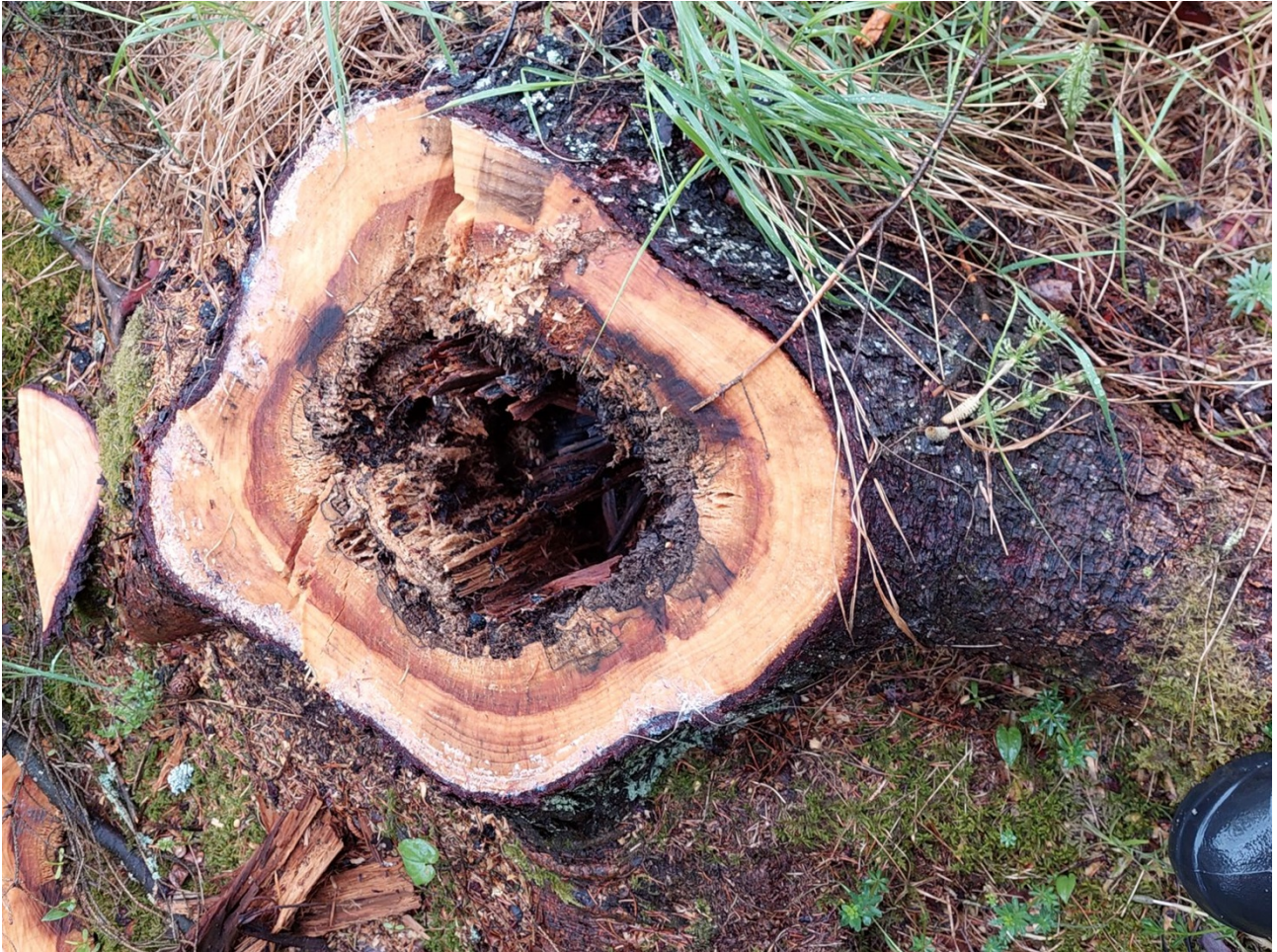
Kuva 1 Laho kuusi

”Kuusen tyvilaho on kasvavissa kuusissa esiintyvä lahovika, joka leviää runkoon juuristosta käsin. Laho valtaa ensin sydänpuun rungon tyvässä ja etenee sitten vähitellen ylemmäs ja laajemmalle rungossa. Taudin viime vaiheessa rungosta alkaa vuotaa pihkaa, latvus harsuuntuu ja lopulta puu kuolee, usein kaarnakuoriaisten hyökkäyksen seurauksena. Yleensä kuitenkin tuuli kaataa lahojuurisen ja -tyvisen puun jo sitä ennen.” Luke