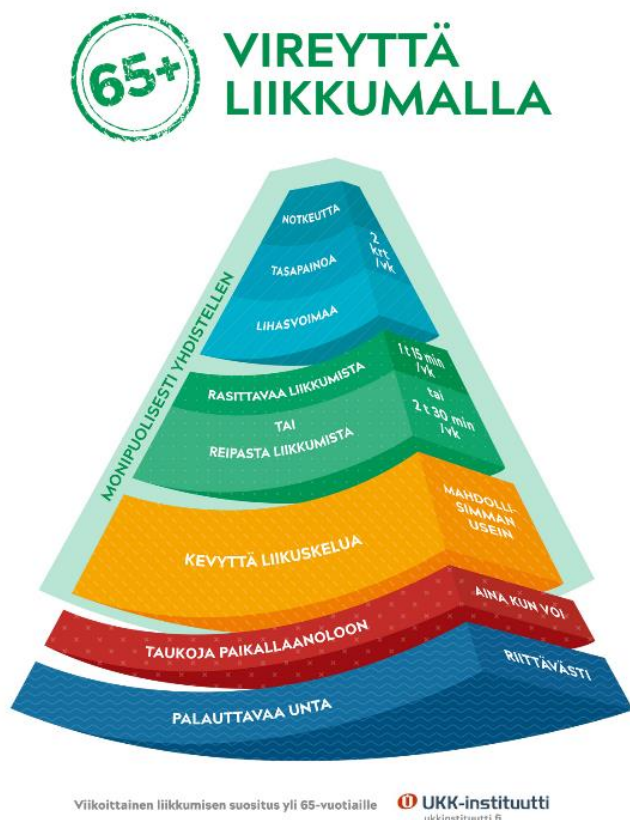
Kuva 6. Viikoittainen liikkumisen suositus yli 65-vuotiaille.

Ikääntyvä yhteiskunta haastaa kaikki tarkistamaan ja muuttamaan käsitystä vanhuudesta elämänvaiheena. Nykyisin ikääntymiseen suhtaudutaan positiivisesti ja sitä tarkastellaan uusista näkökulmista, muun muassa kokonaisvaltaisen voimavara-ajattelun ja sen tukemisen näkökulmasta. (Loviisan kaupungin ikääntymispoliittinen ohjelma 2013–2020)