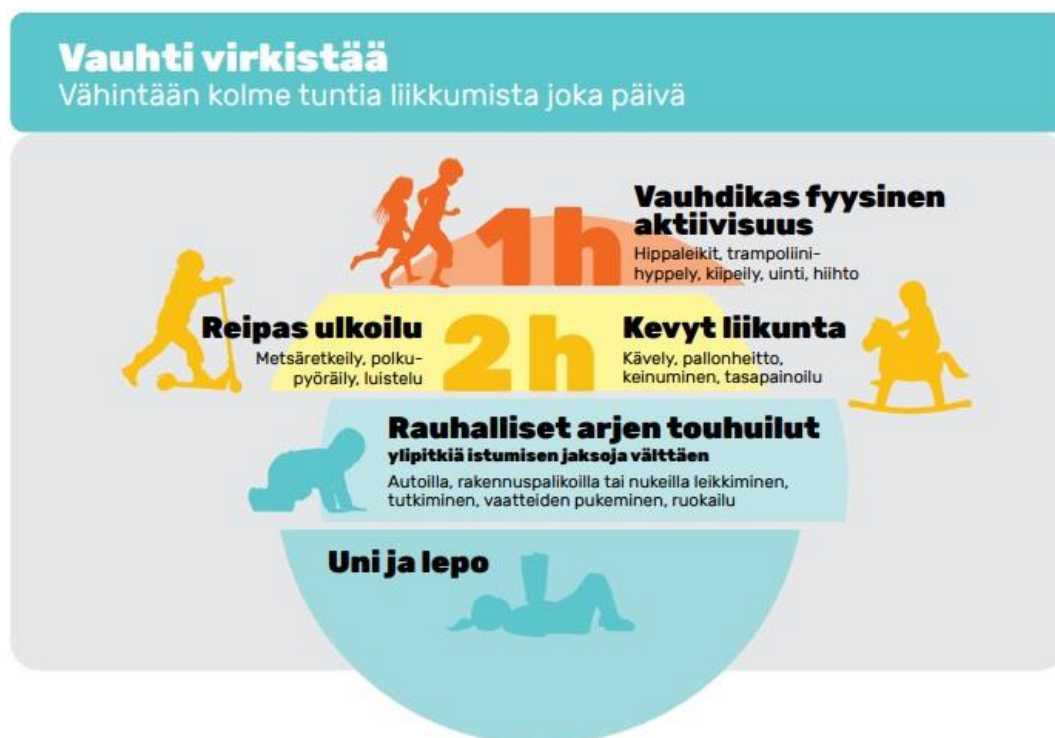
Kuva 1. Suositeltava fyysinen aktiivisuus koostuu päivän mittaan kuormittavuudeltaan erilaisista arjen touhuista.

Liikkuminen tukee alle kouluikäisen lapsen tervettä kasvua sekä kokonaisvaltaista kehitystä. Pienillä lapsilla liikkuminen ja liikunta on yhtä lailla inhimillinen tarve kuin syöminen ja nukkuminen. Lasten varhaisvuosien fyysisen aktiivisuuden suosituksien mukaan alle 8-vuotiaiden lasten päivään pitäisi sisältyä vähintään kolme tuntia liikuntaa. Se muodostuisi kevyestä liikunnasta ja reippaasta ulkoilusta sekä erittäin vauhdikkaasta fyysisestä aktiivisuudesta. Osa liikunnasta toteutuisi varhaiskasvatuksessa, osa kotona. Yli tunnin pituisia istumisjaksoja tulisi välttää ja lyhyitäkin paikallaanoloja tauottaa. Liikunta ja liikunnallinen lapsuus vähentävät terveyspalveluiden käyttöä ja niiden aiheuttamia kustannuksia. Liikunnasta onkin hyötyä paitsi yksilölle myös yhteiskunnalle. Suosituksissa korostetaan myös riittävää lepoa ja unta sekä terveellistä ravintoa. (Iloa, leikkiä ja yhdessä tekemistä – Varhaisvuosien fyysisen aktiivisuuden suositukset, 2016)