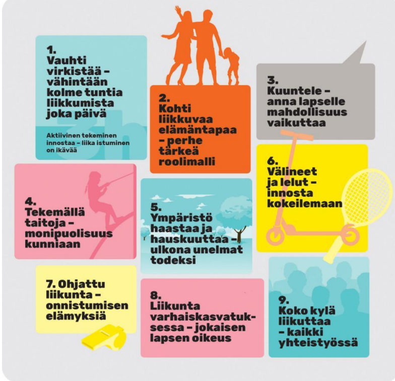
Kuva 2. Lasten fyysinen aktiivisuus on iloa, leikkiä ja yhdessä tekemistä.

Varhaisvuosien fyysisen aktiivisuuden suositukset