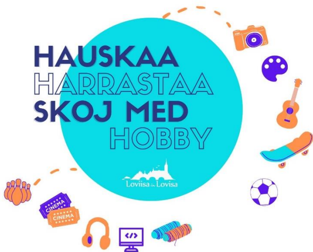
Kuva 4. Hauskaa harrastaa – Skoj med hobby.

Hanke toteutetaan Loviisassa yhteistyössä koulutoimen ja kulttuuri- ja vapaa-aikapalveluiden kanssa. Ohjaajat harrastuksissa ovat joko lajinsa harrastajia tai sitten alan ammattilaisia. Toiminta on maksutonta osallistujille.