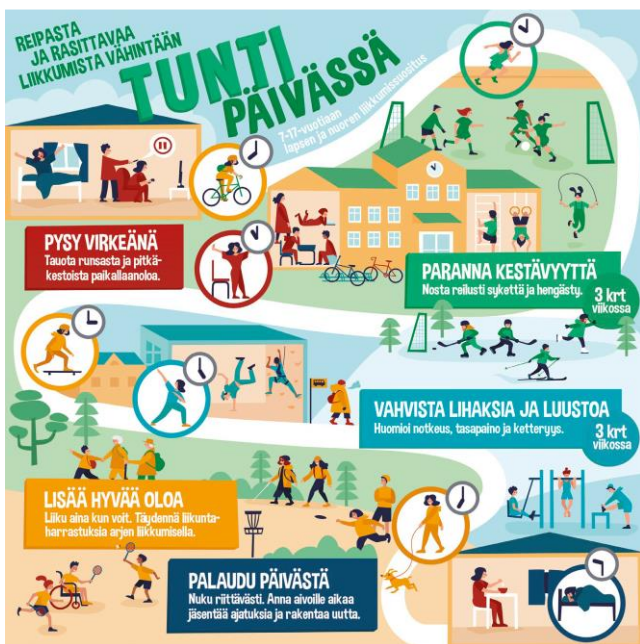
Kuva 3. 7-17-vuotiaan lapsen ja nuoren liikkumissuositus.

Liikunnalla on oikein toteutettuna paljon mahdollisuuksia kouluikäisten terveyden ja hyvinvoinnin edistämiseksi.