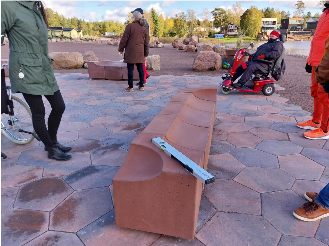
Kuva 8 Matala Rocklinepenkki ilman selkä- ja käsijohdetta