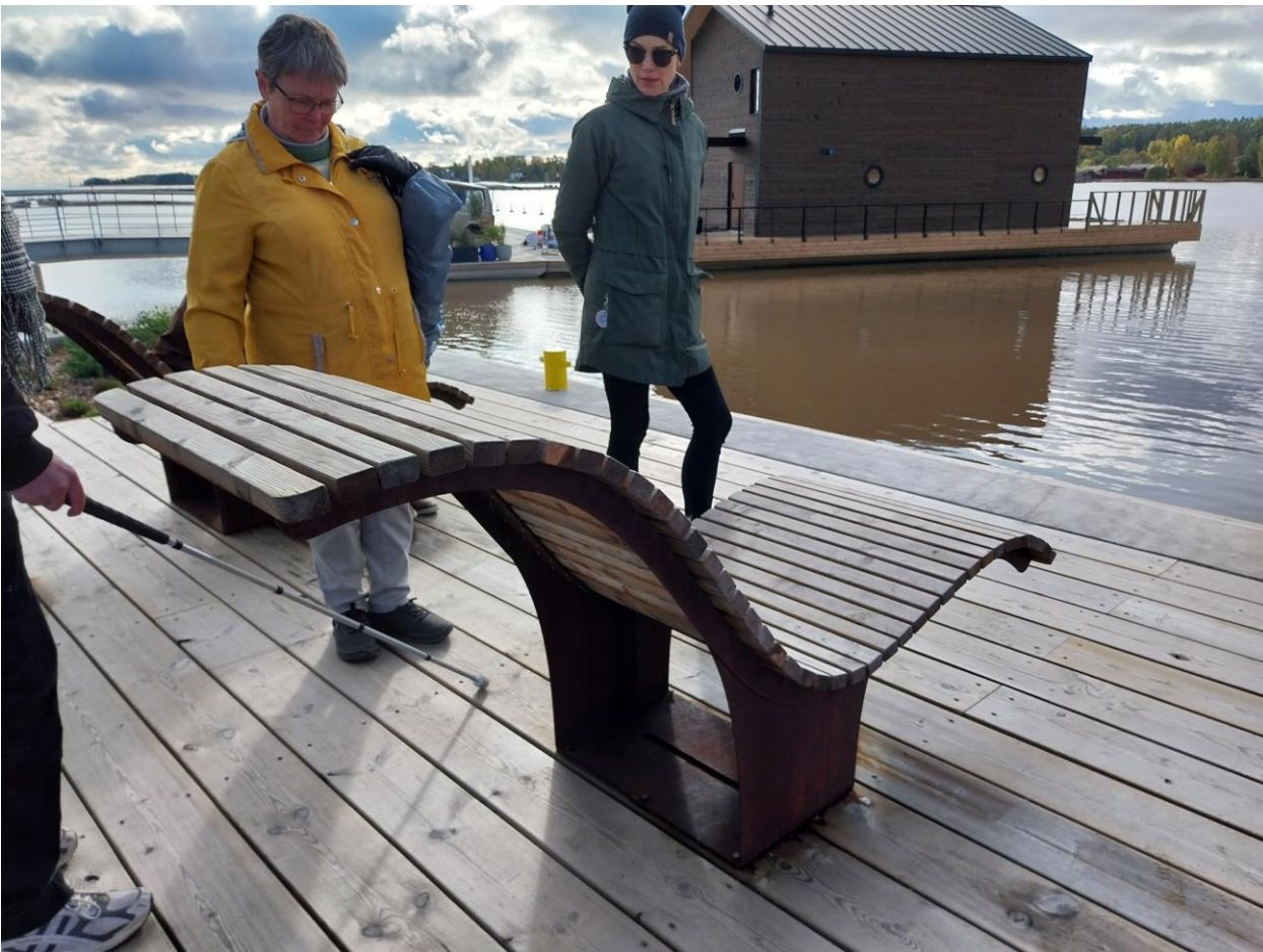
Kuva 5 Aurinkotuoli ja betonireuna ilman heräteraitaa