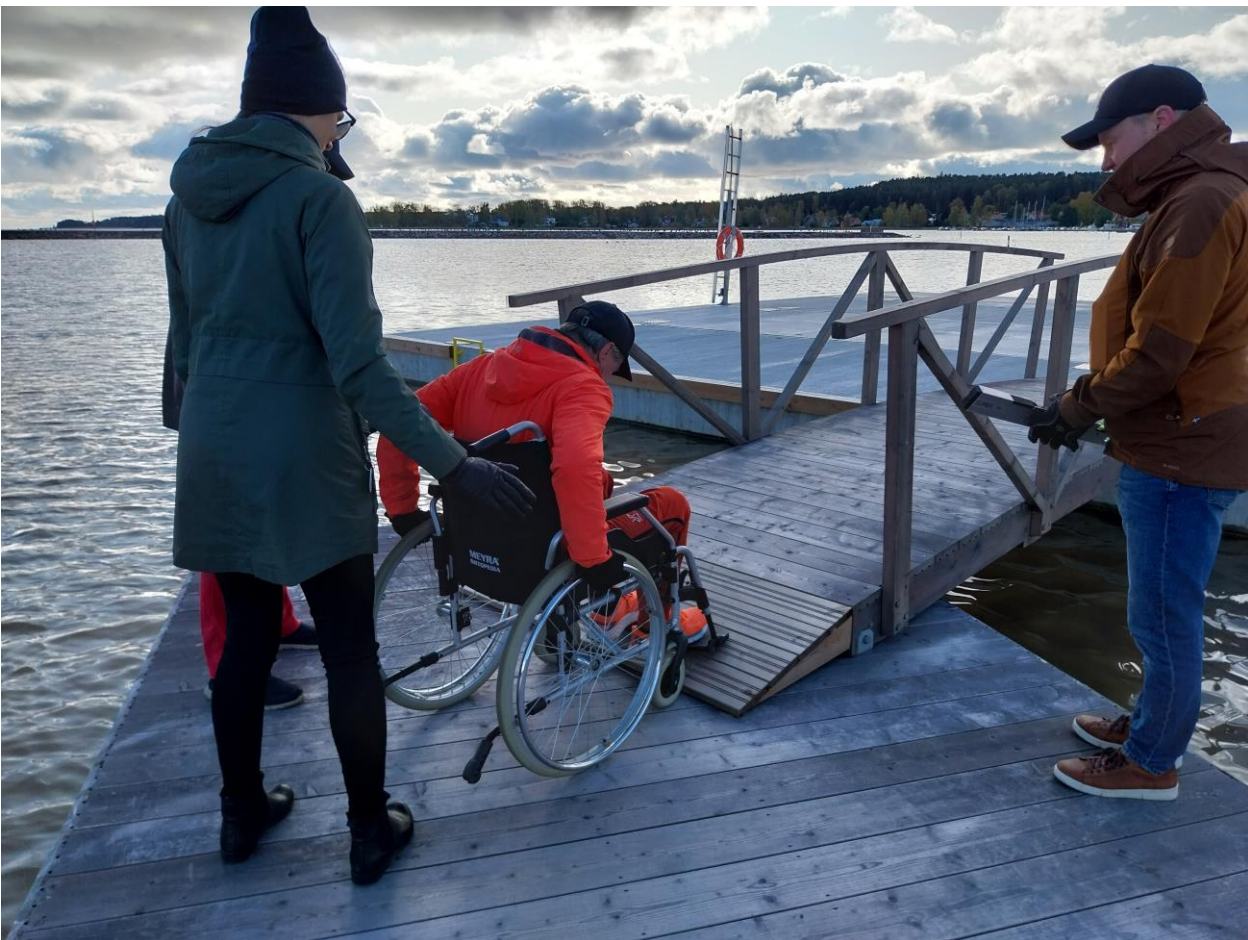
Kuva 12 Kelluvan kadun liitoslaiturin kulma