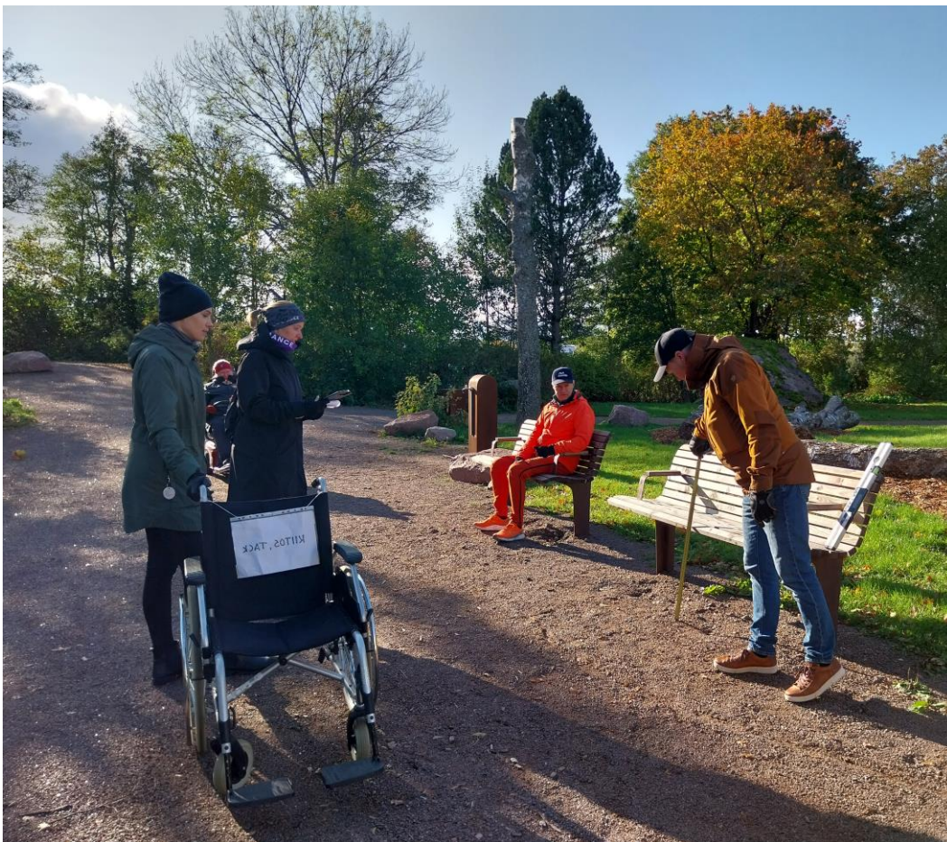
Kuva 20 Puistonpenkit käsijohteilla Metsäpuistossa