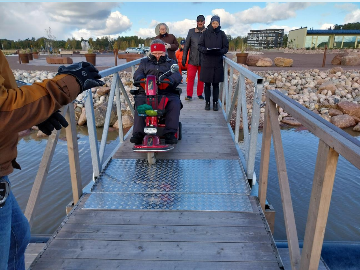
Kuva 11 Kelluvan kadun yhdyslaiturin liitoskohta