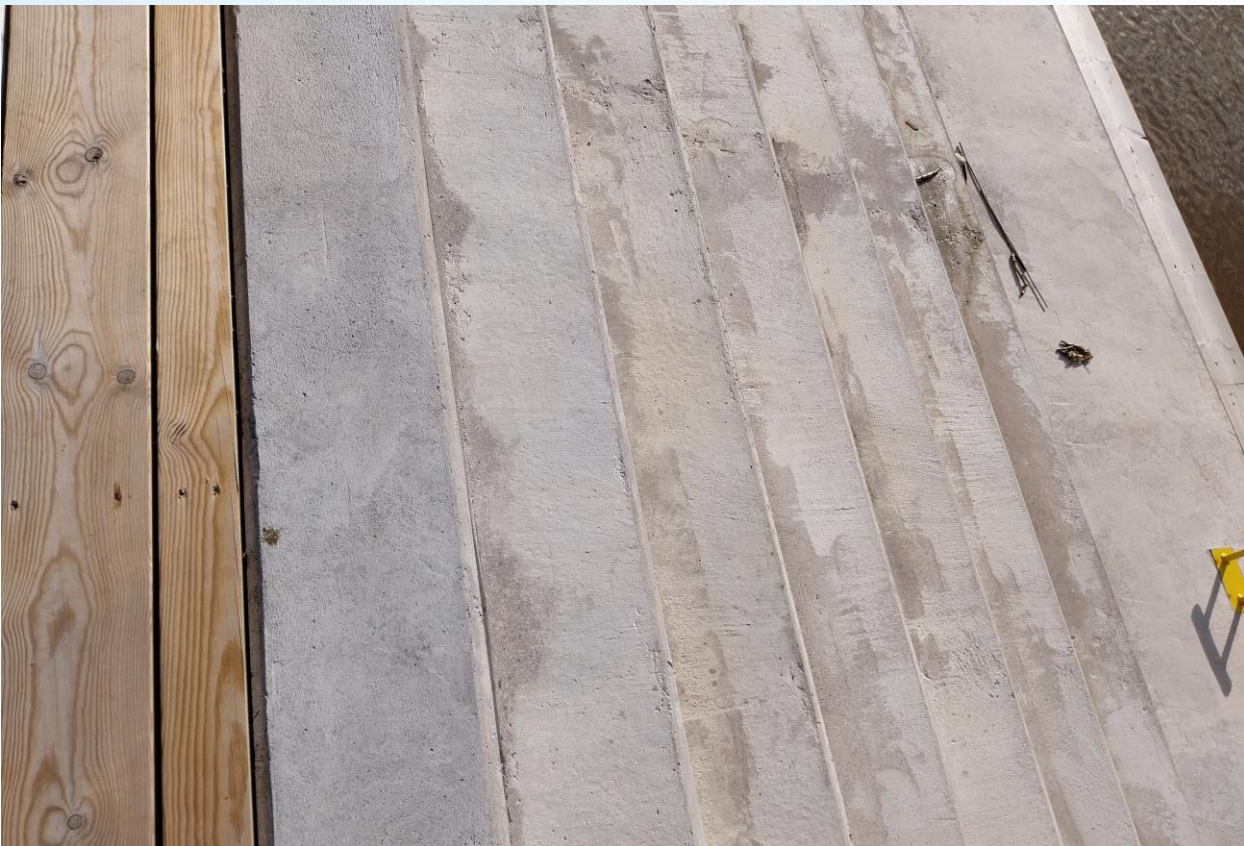
Kuva 4 Puisen laituralueen betonirappuset ilman kontrastiraitoja