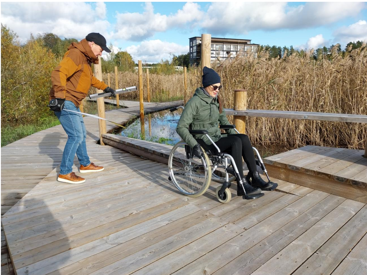
Kuva 16 Ruokopolun esteetön taukopaikka