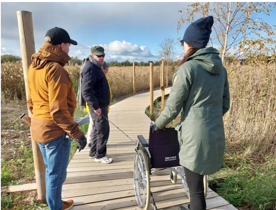
Kuva 14 Ruokopolku ilman suojariekaa