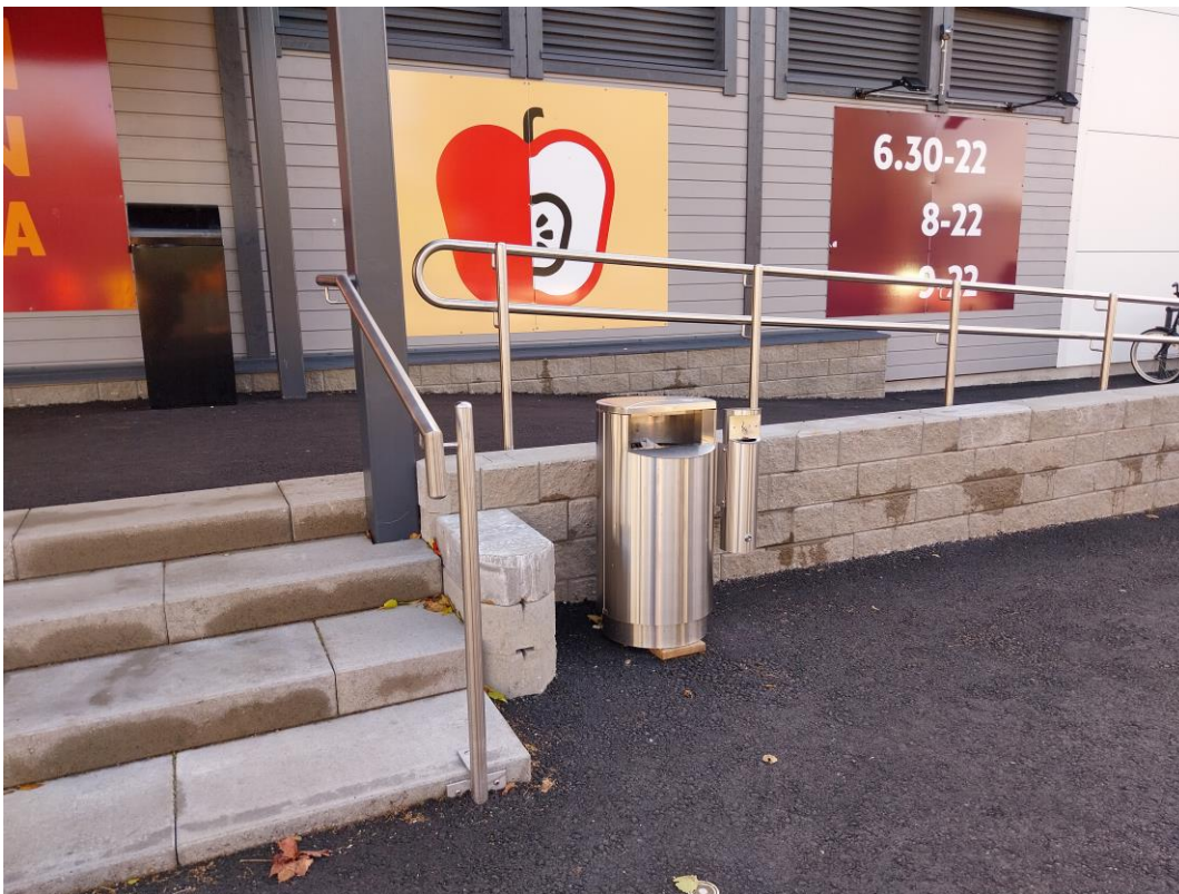
Kuva 21 K-market Kuningattarenrannan katettu ja leveä ramppi, jossa käsijohteet kahdessa tasossa