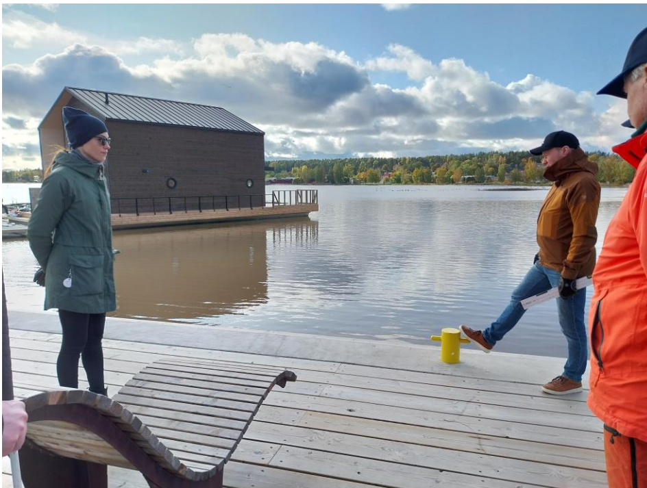
Kuva 3 Puisen laiturialueen betonireuna ilman värikontrasteja