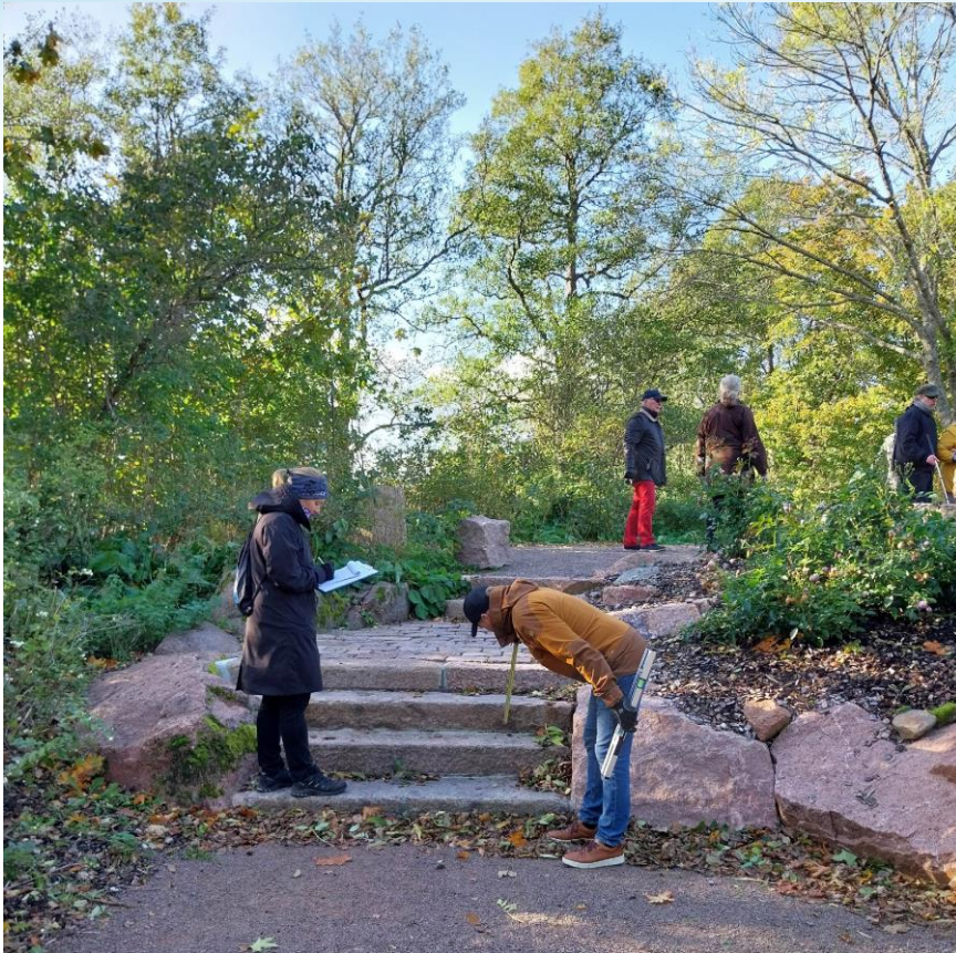
Kuva 19 Metsäpuiston taukopaikalle vievät portaat ja oikealla kulku hiekkapolun kautta