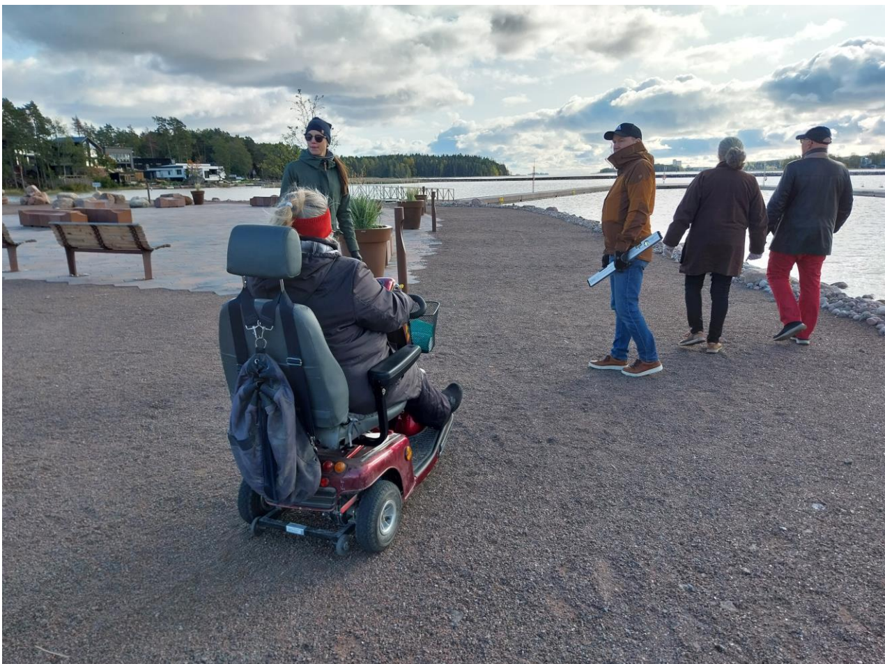
Kuva 7 Osallistujat kulkevat kovalla ja tasaisella Rantabulevardin hiekkareitillä