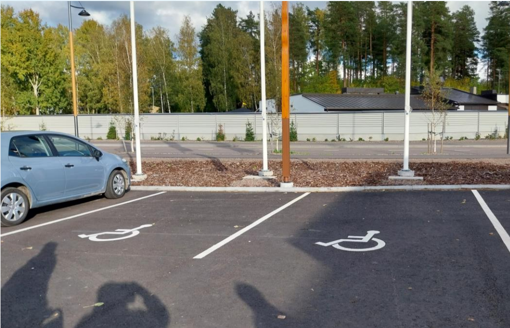
Kuva 23 K-market Kuningattarenrannan invapysäköintipaikat ilman ISA liikennemerkkiä