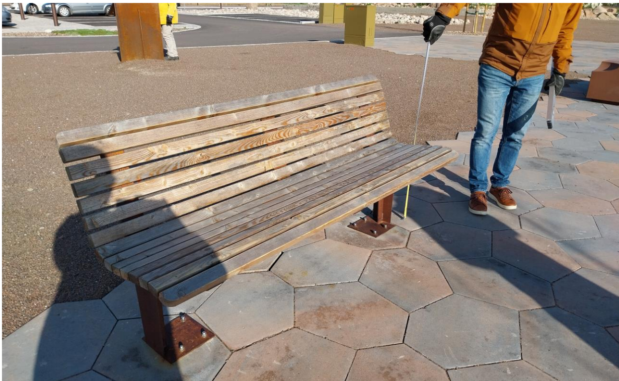
Kuva 9 Tasainen ja tiivis kivetys ja puistonpenkki ilman käsijohdetta