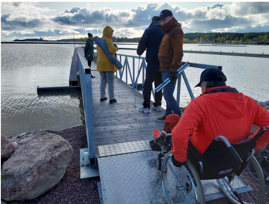
Kuva 10 Pyörätuolilla yritetään päästä ylös rampilta Kelluvan kadun liitoslaiturille