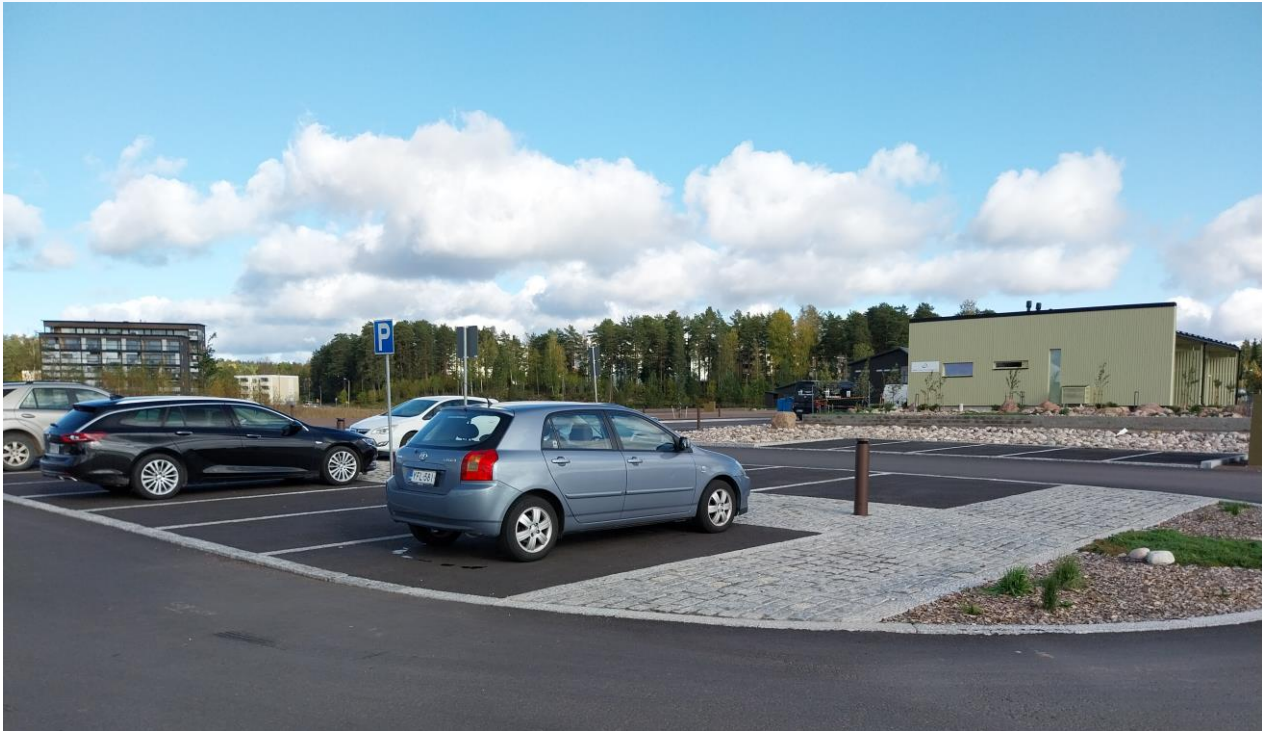
Kuva 6 Pysäköintipaikat ilman ISA liikennemerkkiä (invapaikkamerkkiä) ja merkintää asfaltilla