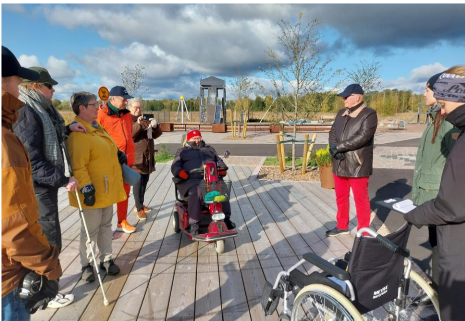
Kuva 2 Osallistajat Victorianaukion puisella laiturialueella