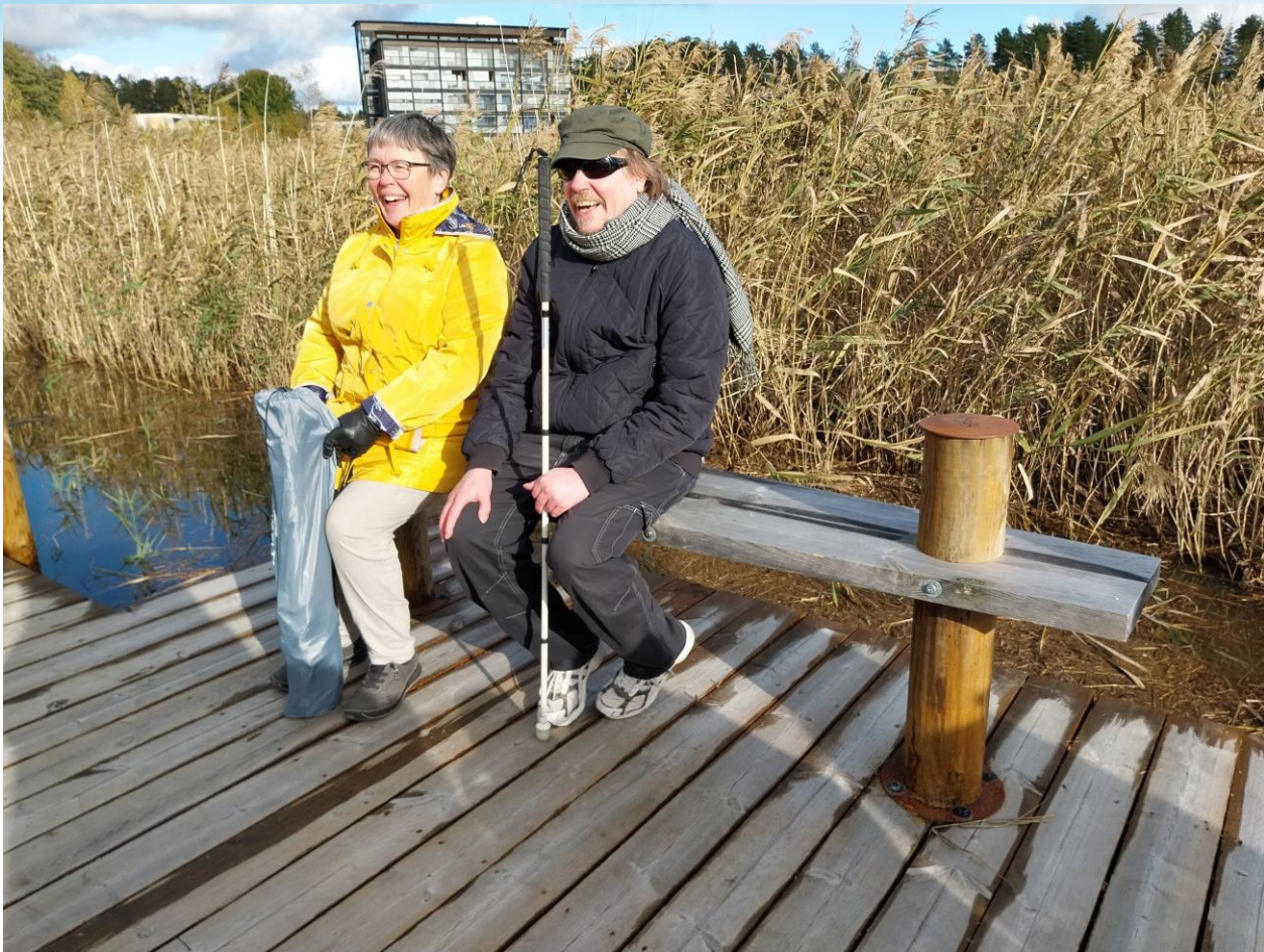
Kuva 15 Penkki Ruokopolulla