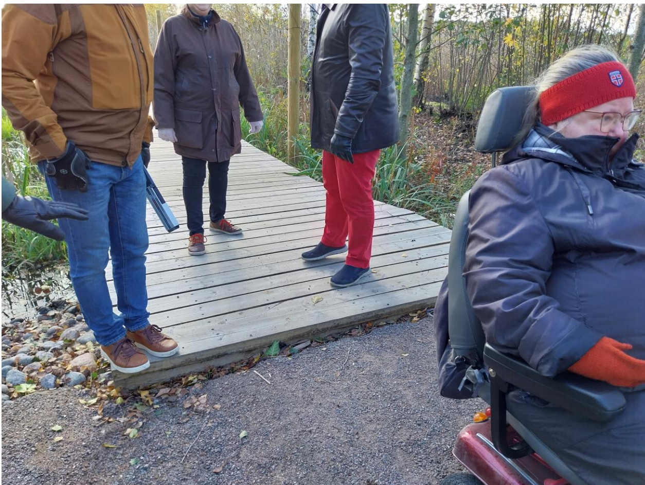
Kuva 18 Kynnys Ruokopolun pitkospuiden ja Metsäpuutarhan hiekkapolun liitoskohdassa