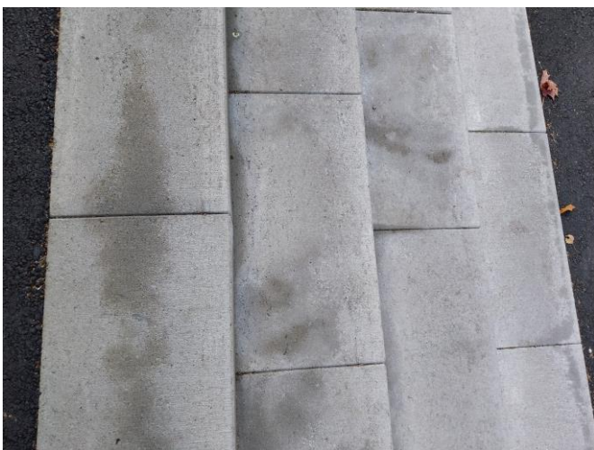
Kuva 22 K-market Kuningattarenrannan portaat ilman kontrastiraitoja