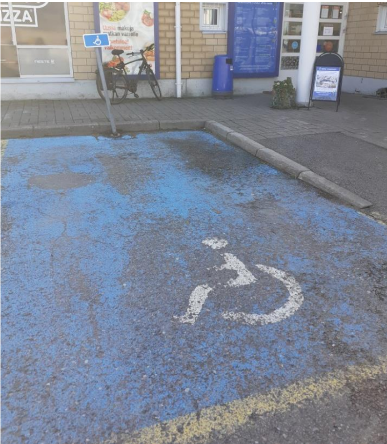
Kuva 24 Malliesimerkki: ISA liikennemerkki ja asfalttimaalaukset Loviisan Nesteellä