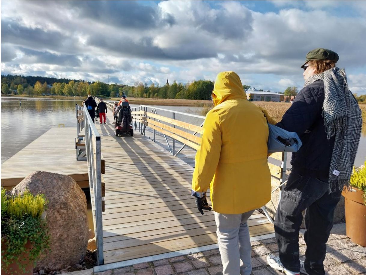
Kuva 13 Osallistujat kulkevat Kruununsillalle