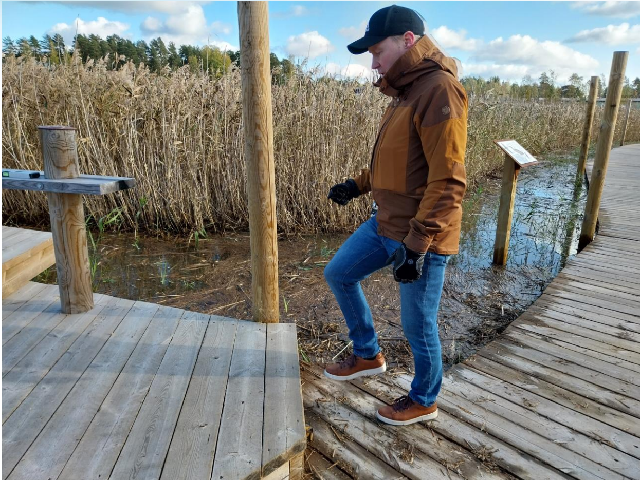
Kuva 17 Ruokopolun esteettömän taukopolun pääty, jossa korkea askelma ilman käsijohdetta