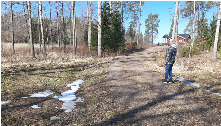
Kuva 6. Rakennuspaikan 1 sisääntulotie. Vasemmalla oleva alue on osoitettu MY-1-alueeksi. Maanomistaja mukana kuvassa.