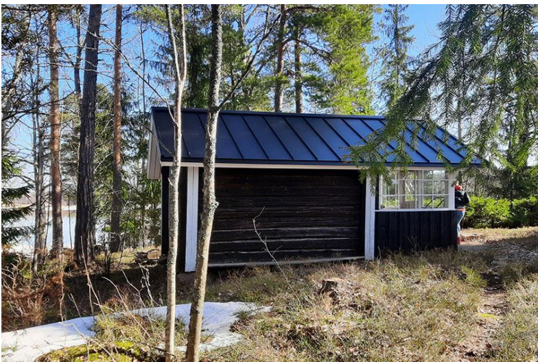
Kuva 12. Rakennuspaikan 2 mökin itäpuolella oleva liiteri.