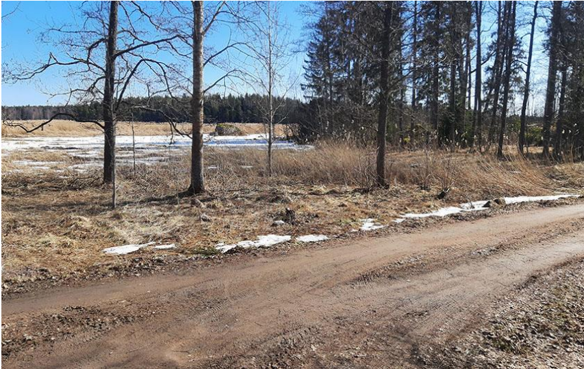
Kuva 8. Kaakkoisosassa oleva MY-1-alue.