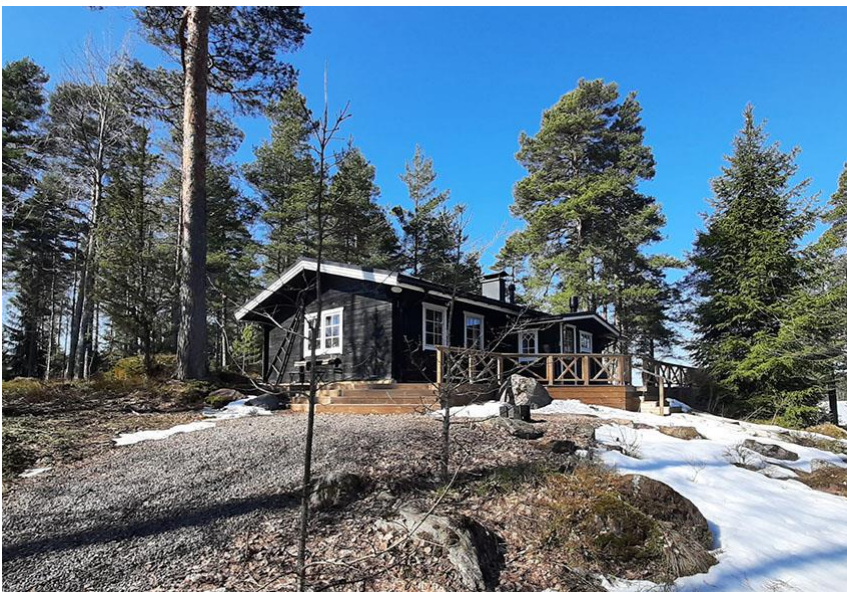
Kuva 9. Rakennuspaikan 2 vapaa-ajanmökki.