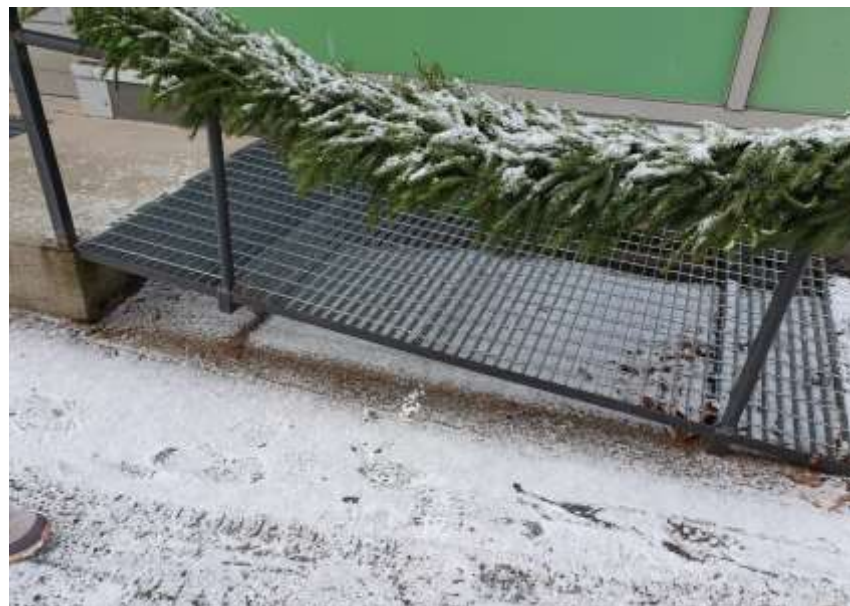
KUVA. 13. Ramppi on keskeltä notkahtanut, eli se tulisi tukea keskeltä.