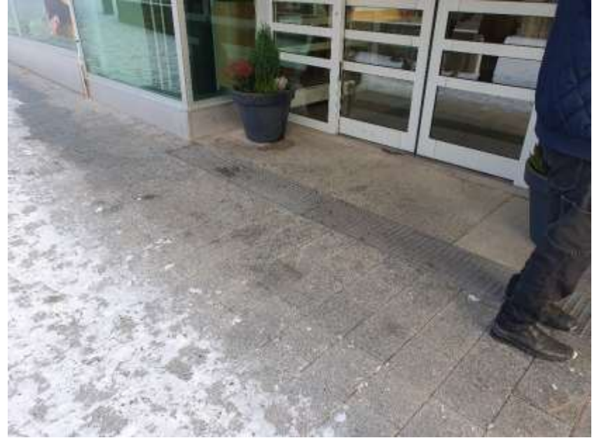
KUVA 5. Sisäänkäynti on nykyään melko esteetön.