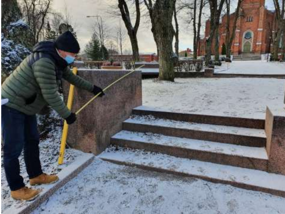
KUVA 9. Käsijohteiden paikat ja kompastumisvaaran aiheuttava alin porras, jonka korkeus poikkeaa muista.