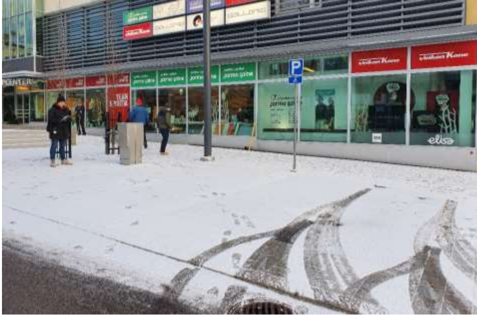
KUVA 4. INVA-paikat, joissa on sivukallistusta.