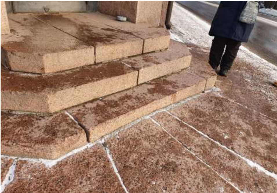
KUVA 10. Apteekin sisäänkäynnin portaat.