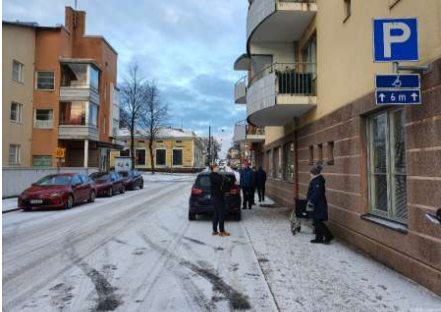
KUVA 3. Esteettömät pysäköintipaikat on merkitty vain kyltein.