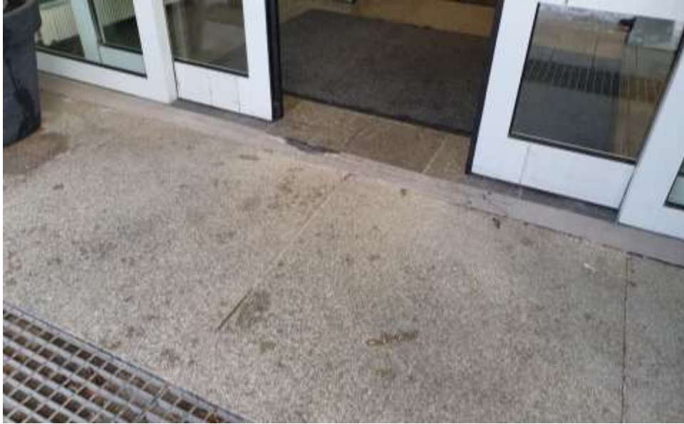
KUVA 6. Ritilän iso silmäkoko ja kynnyks automaattiovien edessä.