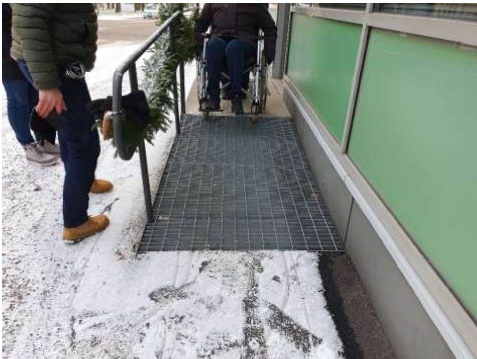
KUVA 12. Asiakaspalvelupisteen ramppi.