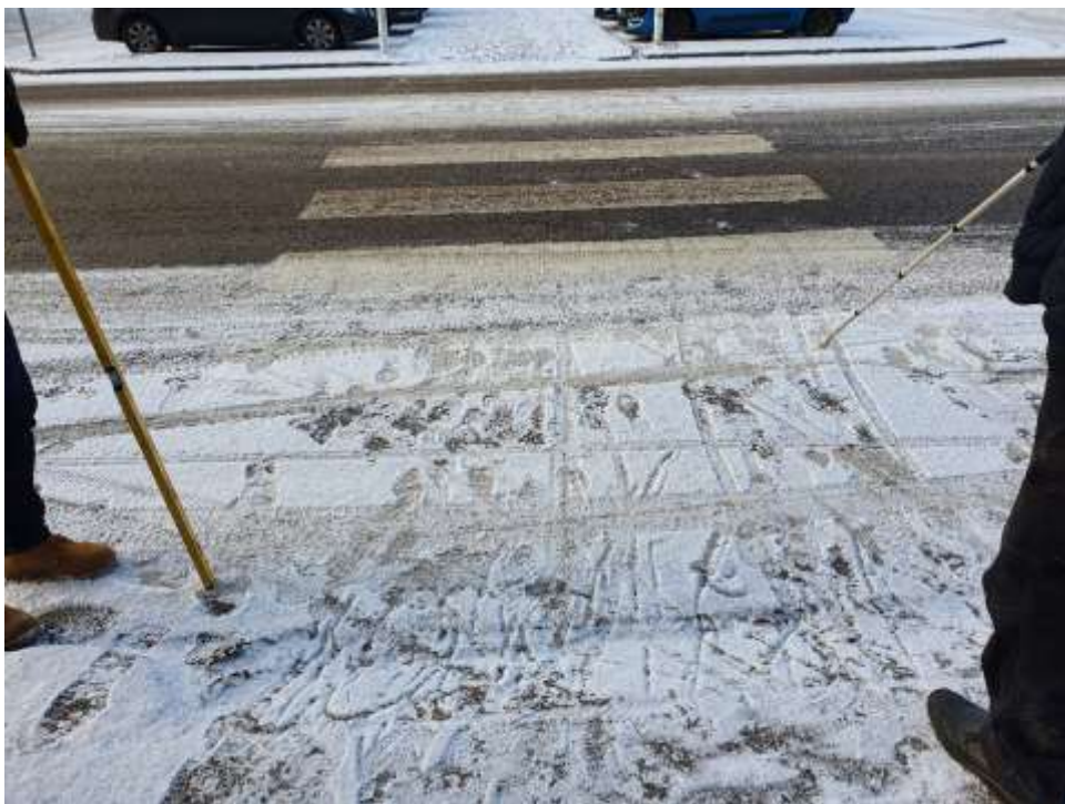
KUVA 7. Suojatie torille, jonka reunoja näkövammaisen on vaikea hahmottaa.