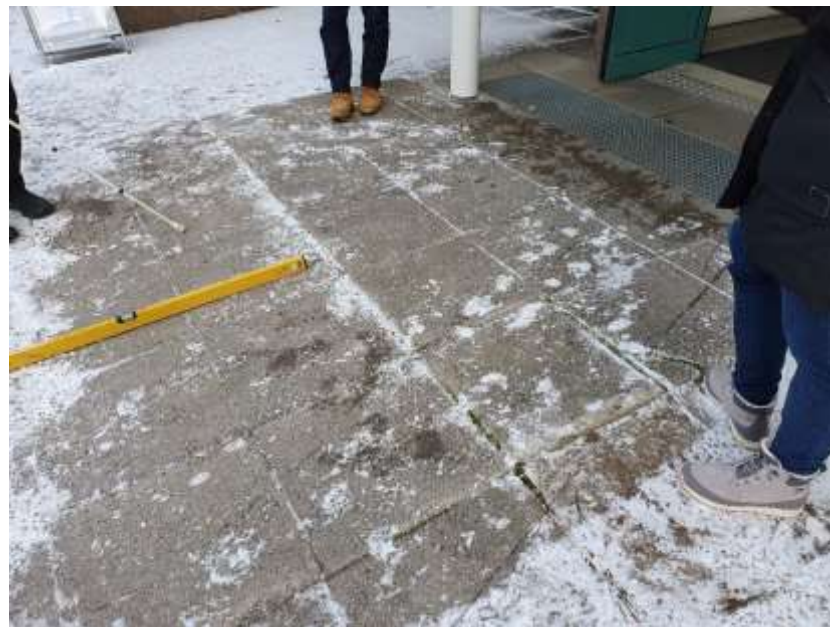
KUVA 2. Sisäänkäynnin kynnys/painuma.