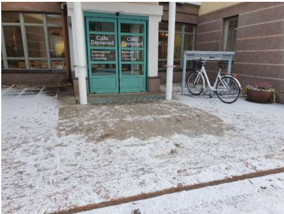
KUVA 1. Palvelutalon sisäänkäynti.