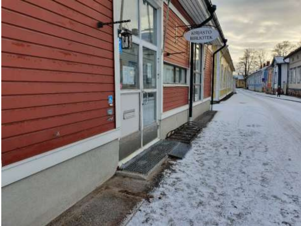
KUVA 14. Kirjaston sisäänkäynnille tulisi toteuttaa leveämpi tasanne ja luiska pohjoisen suunnasta.