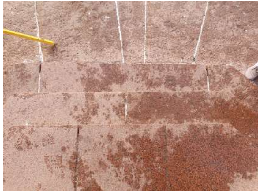
KUVA 11. Heikosti toisistaan erottuvat askelmat.