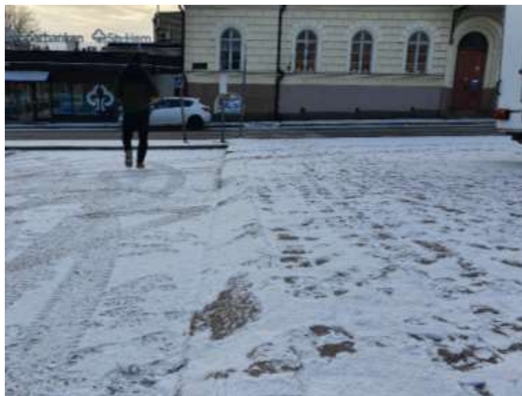
KUVA 8. Nupukivipintainen tori ja hankalat reunakivet INVA-paikalta.