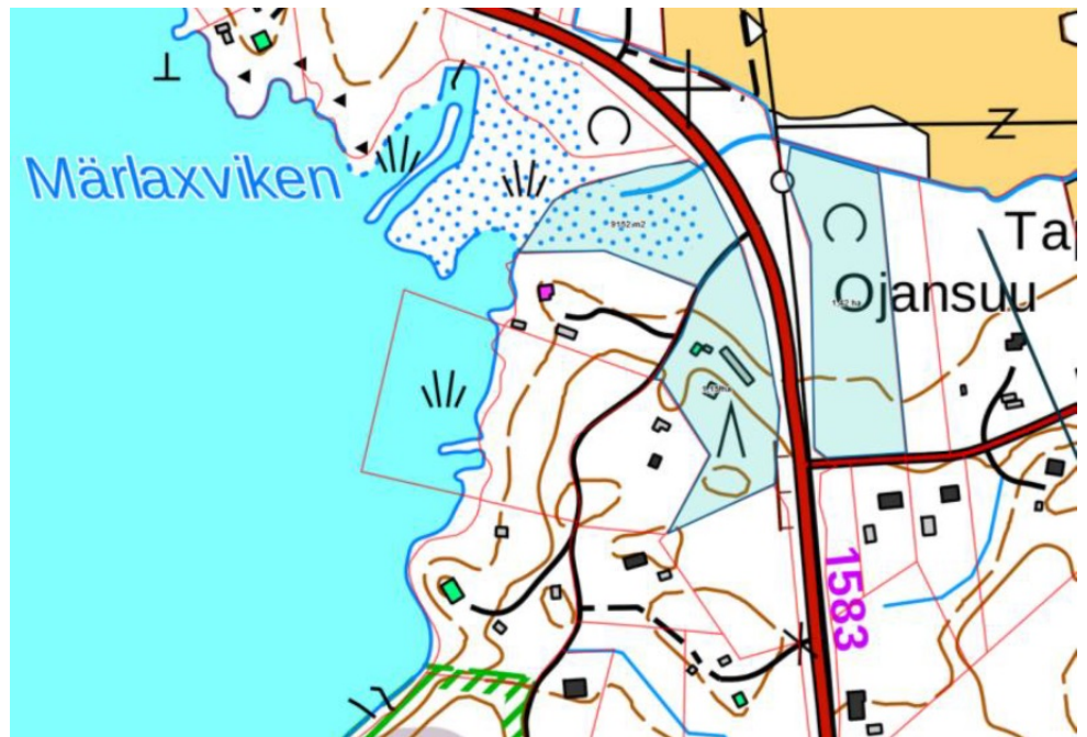
Kuva 1. Kaupan kohde kuvassa vaaleansinisellä täyttövärillä, sijoittuen kahtena palstana Saaristotien molemmiin puoliin.

Alueella on voimassa Loviisan pohjoisosan ja Ruotsinpyhtään Tesjoen osayleiskaava (Lotes), joka on hyväksytty 16.2.2010. Kiinteistö on merkitty osayleiskaavassa pientalovaltaiseksi asuntoalueeksi (kaavamerkintä AP, pinta-ala 25 446 m 2 ), lähivirkistysalueeksi (kaavamerkintä VL, pinta-ala 9 282 m 2 ) ja venevalkama-alueeksi (kaavamerkintä LV, pinta-ala 212 m 2 ).