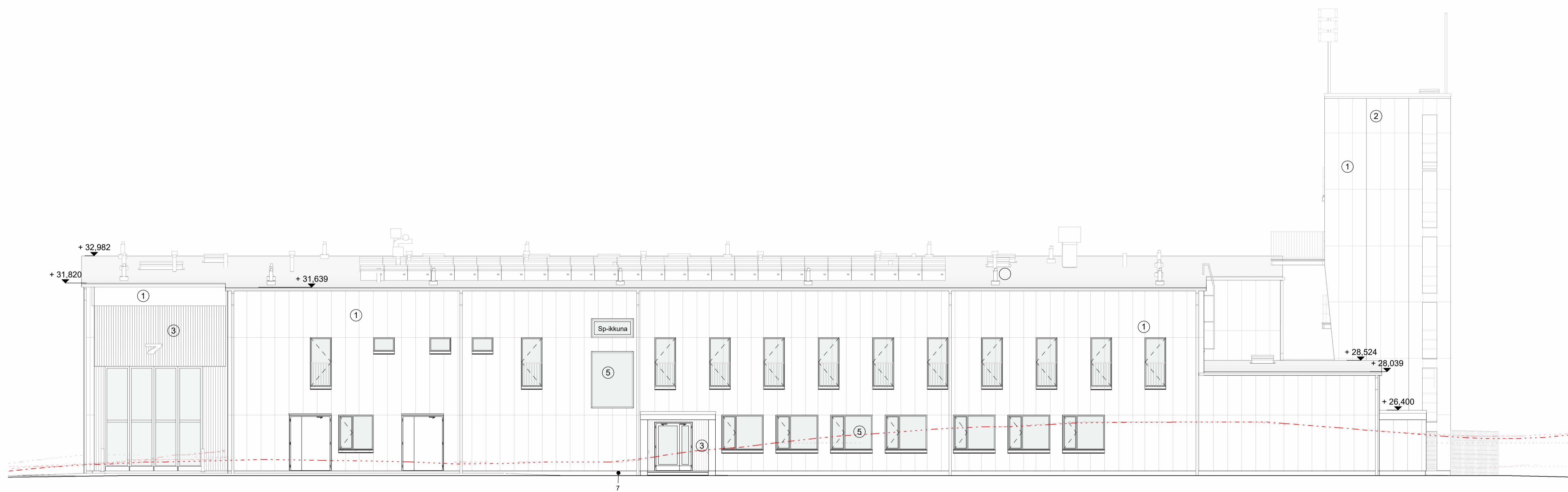
Julkisivu etelään 1:100