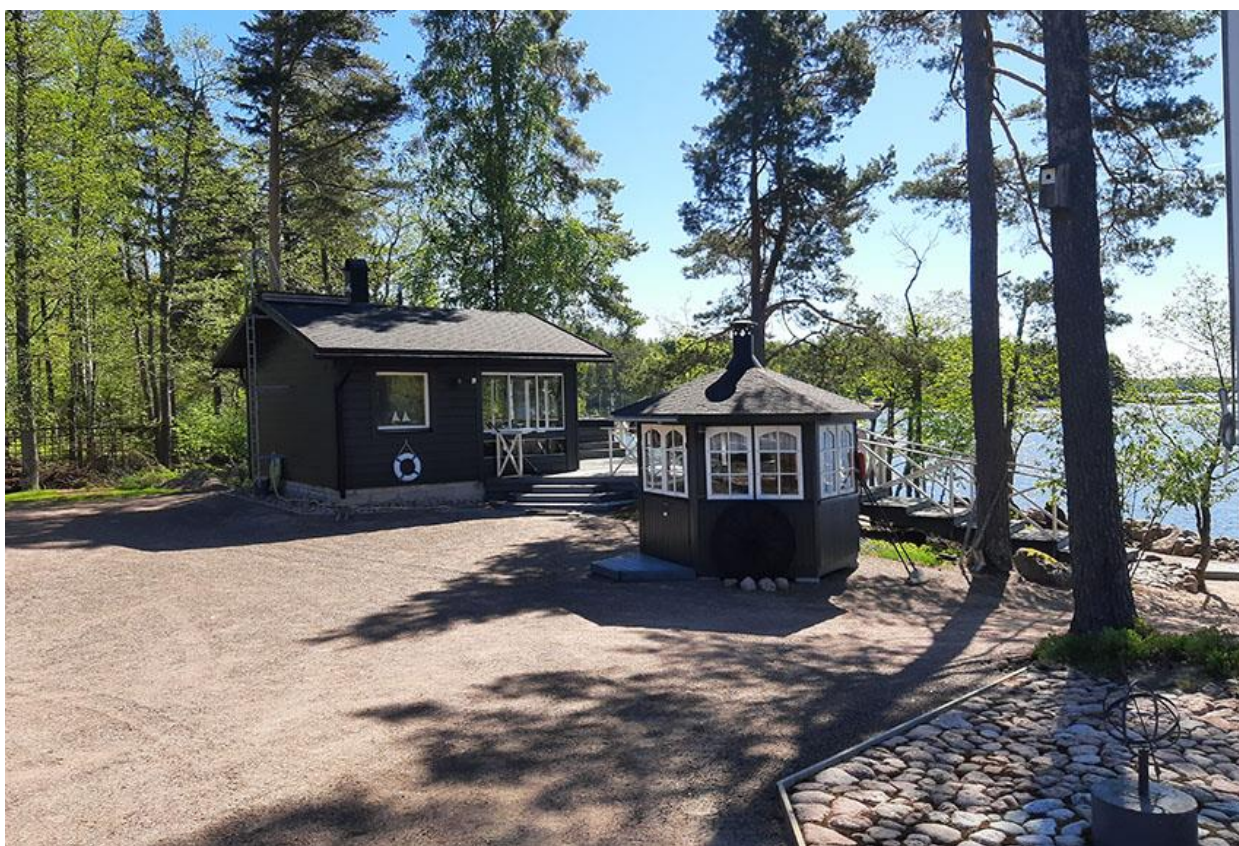
Kuva 9. Rantasauna ja pikkupaviljonki.