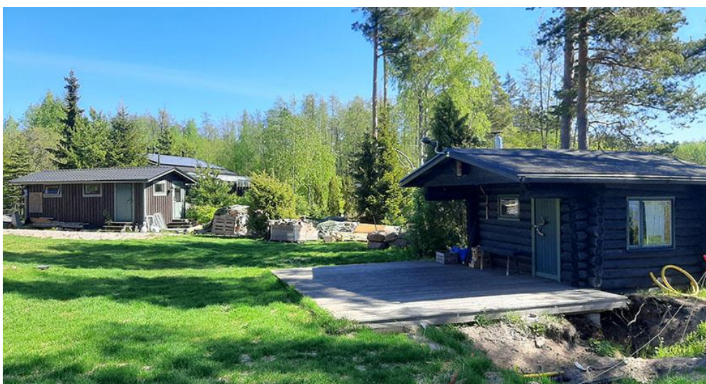
Kuva 7. Sauna oikealla, ja liiteri.