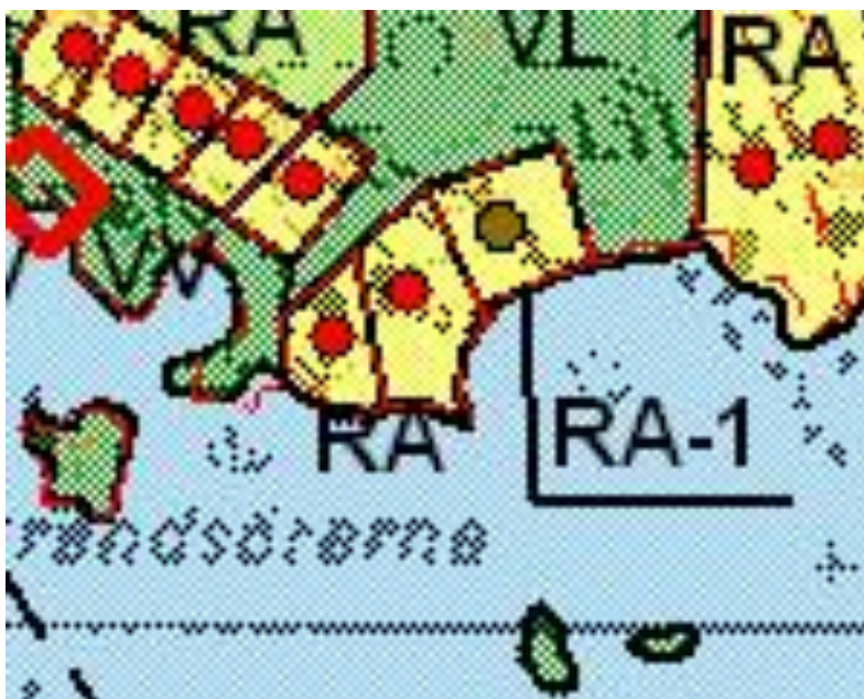
Ote voimassa olevasta Kulla-Lappomin rantaosayleiskaavasta.

Alueella on voimassa 24.2.2003 hyväksytty Kullan-Lappomin rantaosayleiskaava. Kaavassa muutettava ranta-asetmakaava-alue on osoitettu 3 tontin loma-asutusalueeksi. Rakennusoikeus on osoitettu tehokkuusluvulla e=0,05 , kuitenkin enintään 250 kerrosalaneliömetrinä. Kiinteistö-tontin 7-7 rakennusoikeus on osoitettu voimassa olevan ranta-asetmakaavan mukaisena.