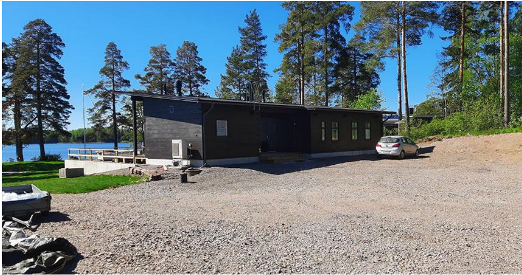
Kuva 5. Juuri valmistunut loma-asunto.