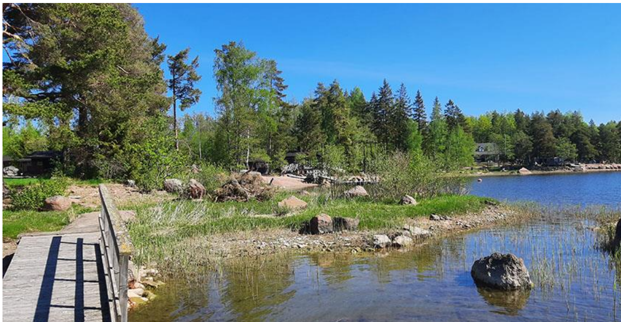
Kuva 15. Rakennuspaikan 3 rantamaisemaa kuvattuna rakennuspaikan 2 laiturilta. Sauna kuvan keskellä, oikealla itäpuolella olevan naapurin loma-asunto.