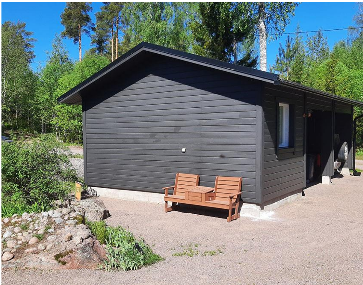
Kuva 14. Liiteri-autokatos.