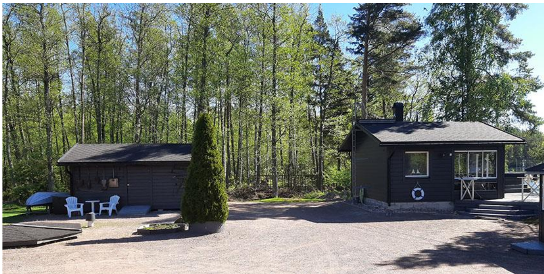
Kuva 10. Rantasauna ja siitä vasemmalle liiteri.