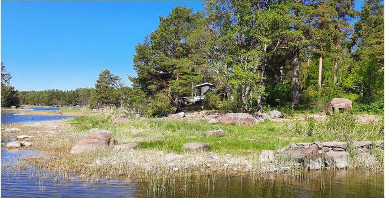
Kuva 1. Rakennuspaikan rantamaisemaa.