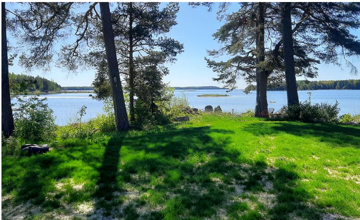
Kuva 8. Merimaisema rakennuspaikan keskeltä kuvattuna.