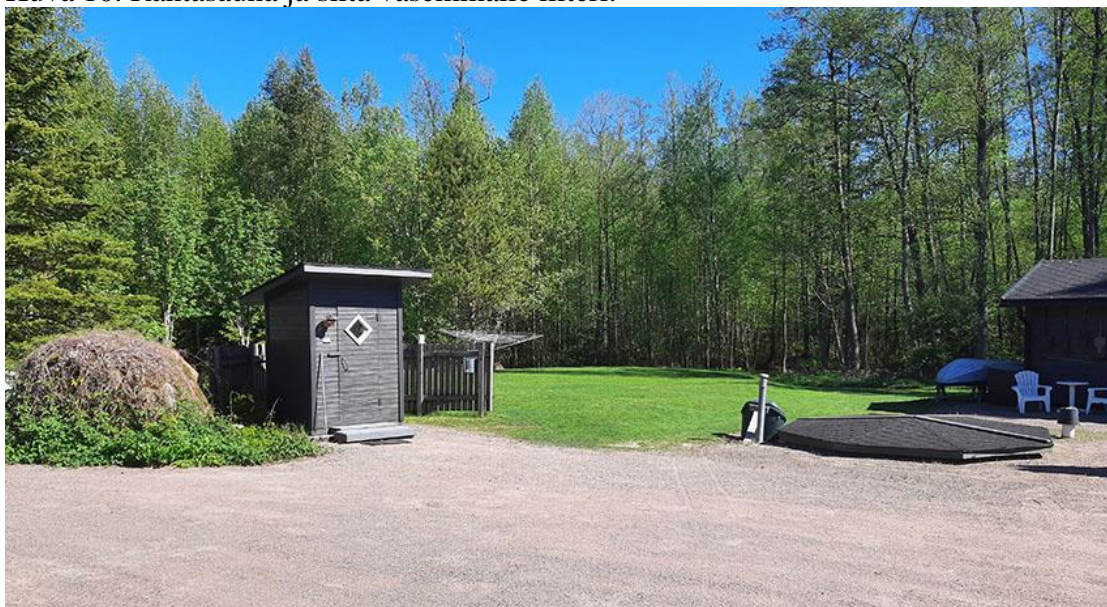
Kuva 11. Edellisen kuvan liiteri oikeassa reunassa ja kuvan keskellä puucee.