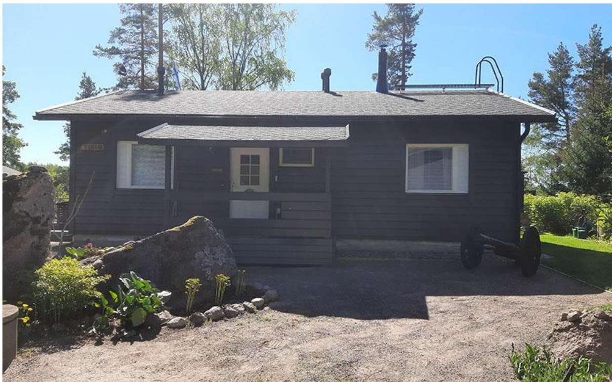
Kuva 13. Loma-asunnon julkisivu pohjoiseen.