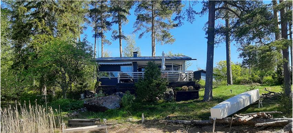
Kuva 3. Loma-asunto kuvattuna rannan suunnasta.