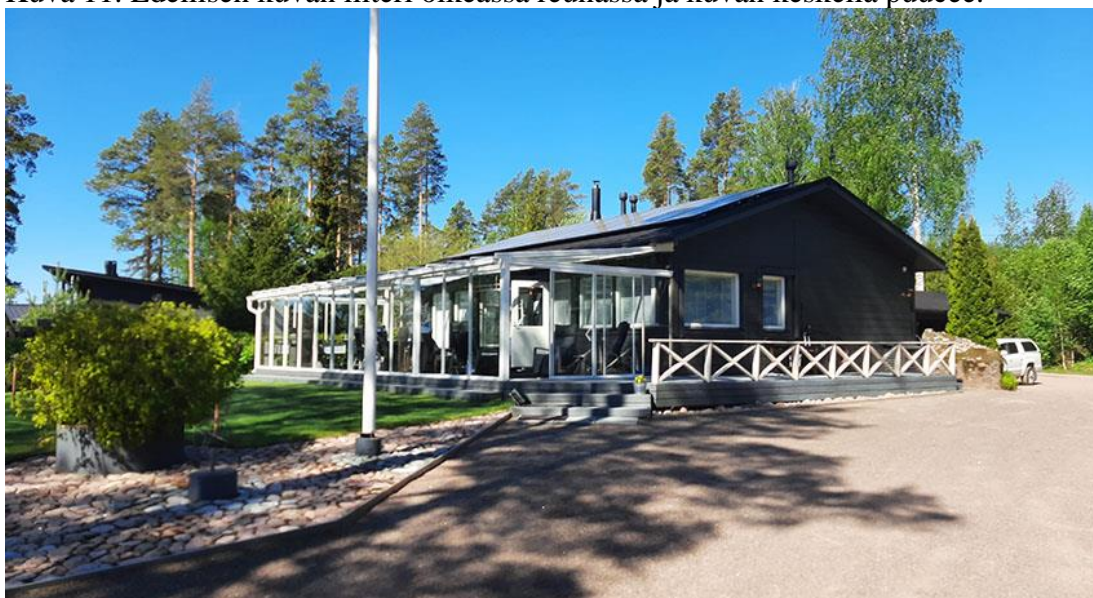
Kuva 12. Loma-asunto saunan suunnasta kuvattuna.