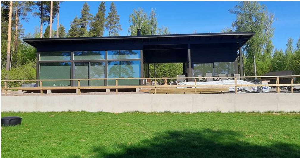
Kuva 6. Uusi loma-asunto rannan suunnasta.