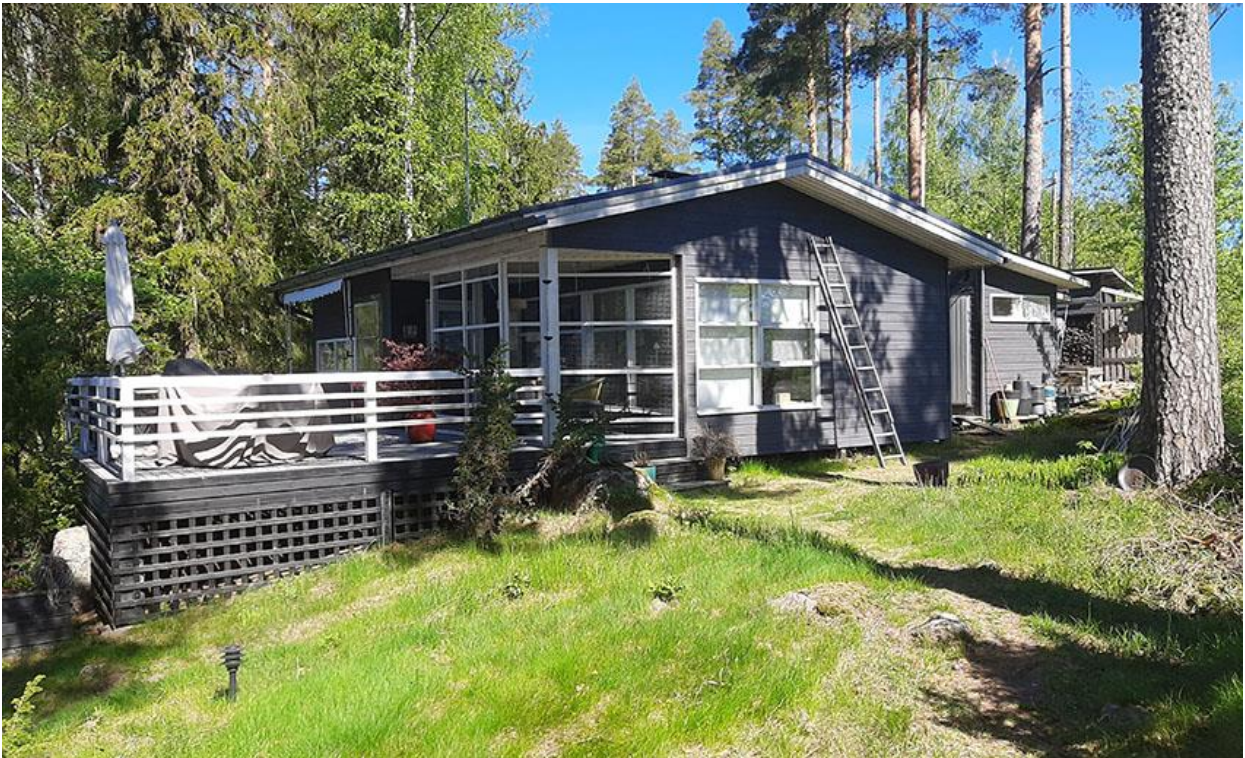
Kuva 4. Loma-asunto kuvattuna lounaan suunnasta.