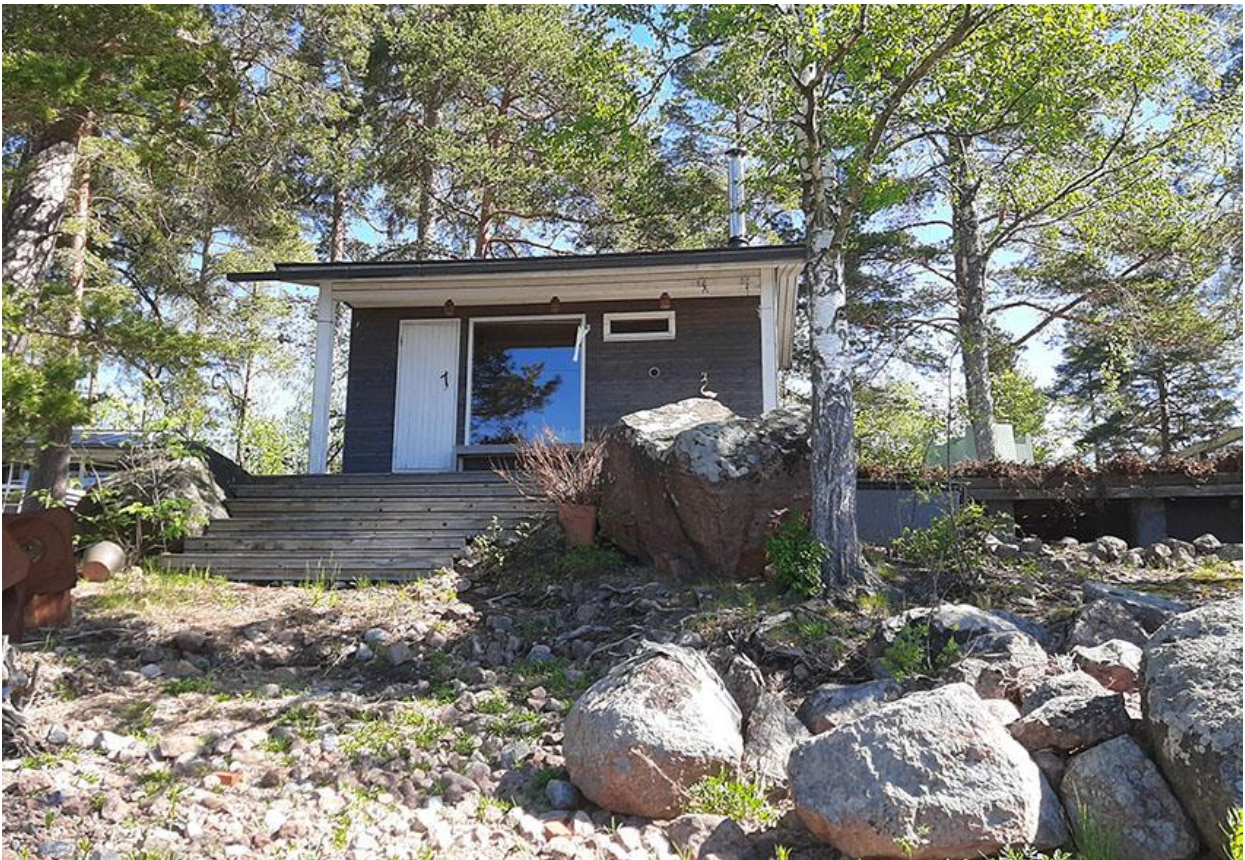
Kuva 2. Sauna kuvattuna rannan suunnasta.