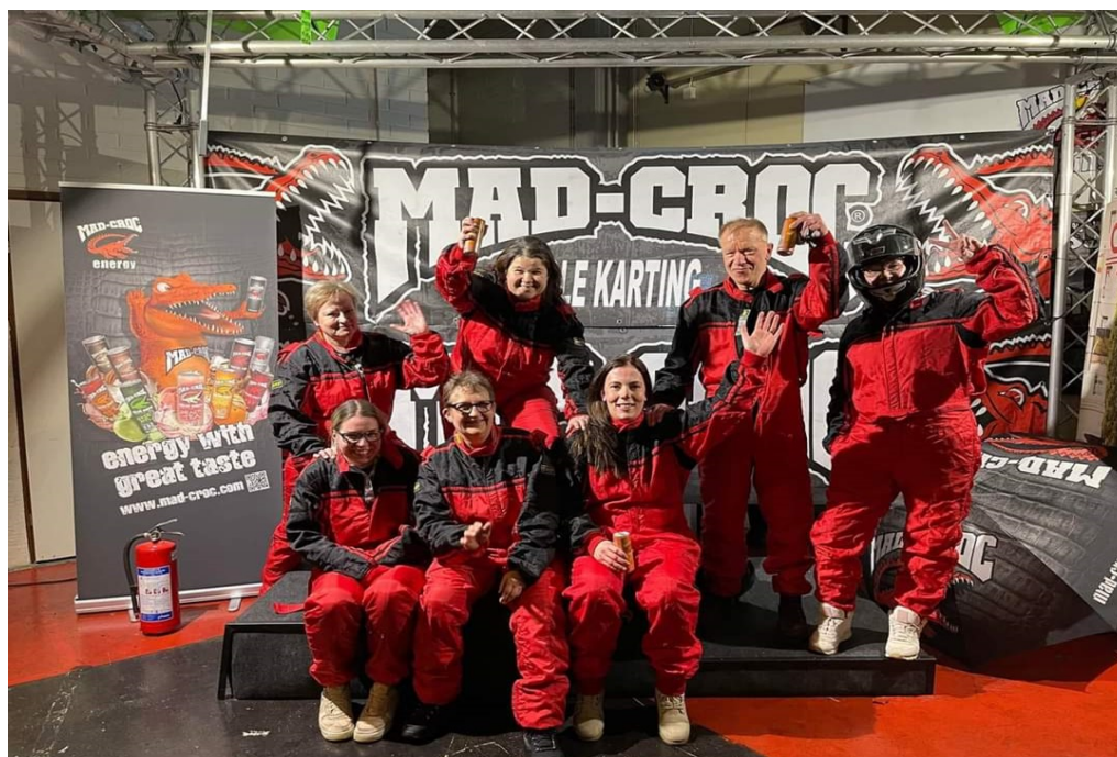
BILD 2: Hemvårdsteamet för östra området testade hur väl körskickligheten utvecklats på jobbet under tykyddag i slutet av 2021.

Utöver detta har cirka 10 procent av cheferna meddelat att de fört 2021 års utvecklingssamtal med anställda i början av 2022.