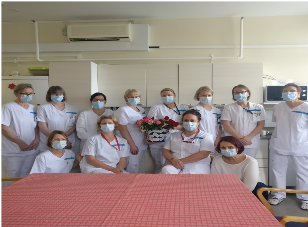
BILD 5: Hälsovårdscentralens vårdavdelning fick rosor av Lions ladies.