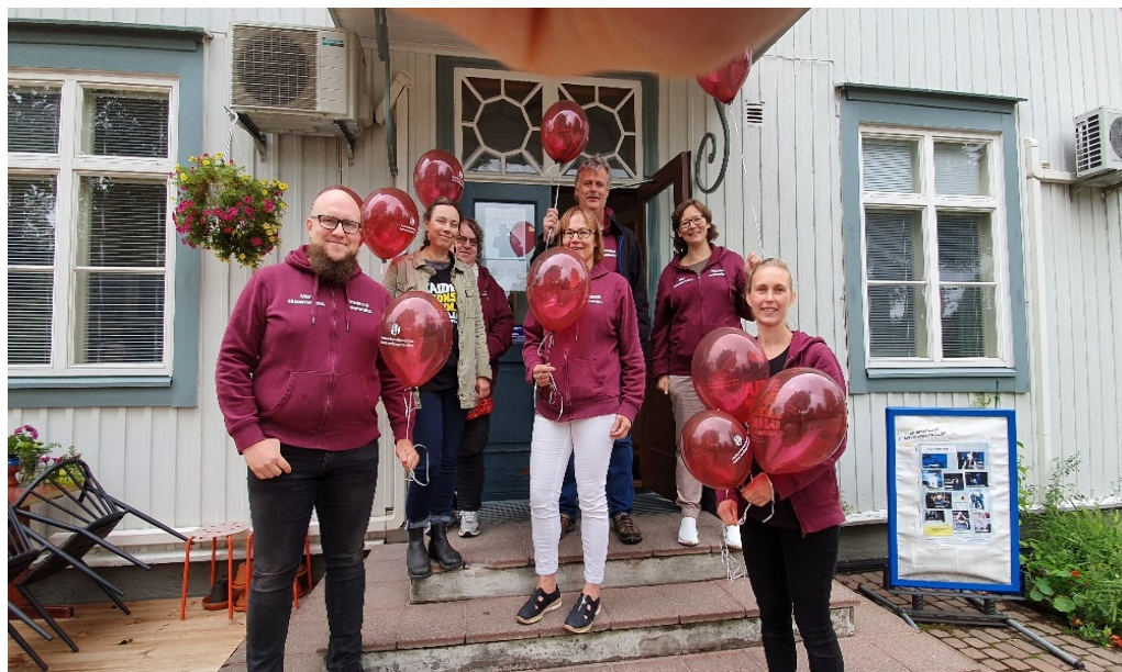
BILD 3: Medborgarinstitutspersonalens marknadsföringsjippo på kulturhuset i Pyttis 18.8.2021.