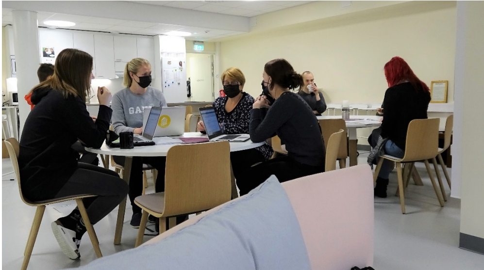
BILD 4: En del av de över hundra anställda vid Harjuntien koulu och Loviisan lukio under en paus.