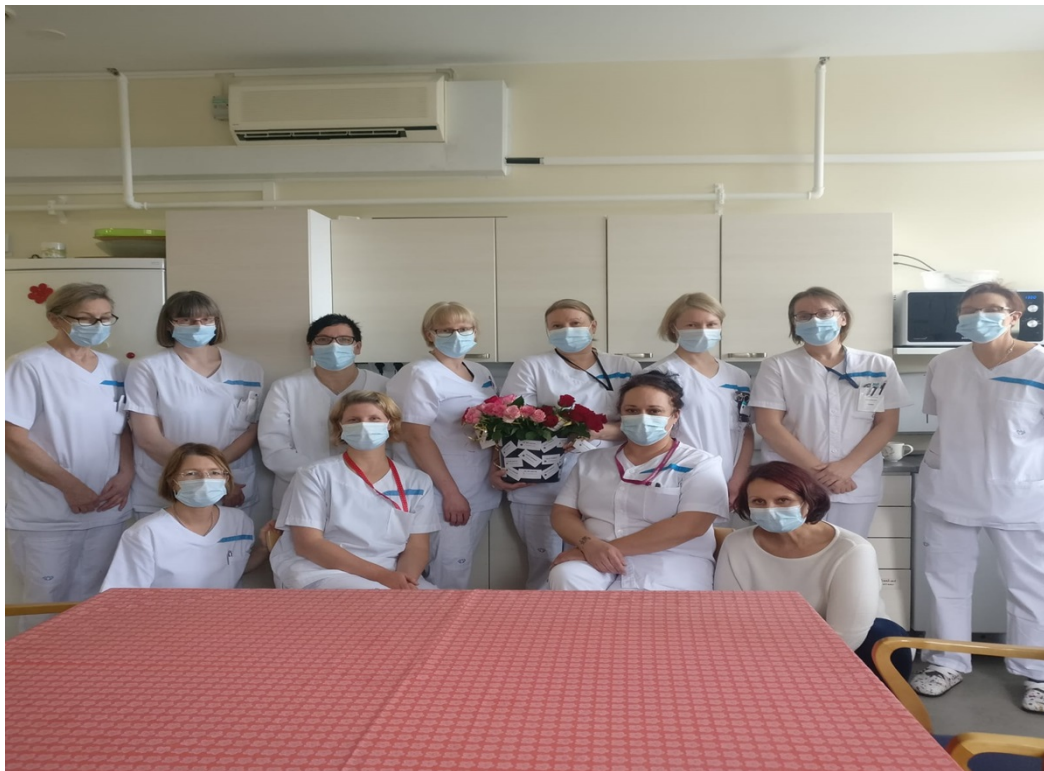
BILD 5: Hälsovårdscentralens vårdavdelning fick rosor av Lions ladies.