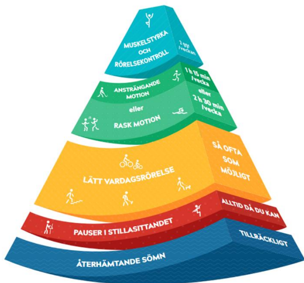
Bild 5. Motionsrekommendation per vecka för 18–64-åringar.

motionsmöjligheterna i byarna och en god allmän uppfattning om motion och idrott skapar förutsättningar för att öka mängden motion och idrott som utövas på egen hand. Idrotts- och motionsverksamheten har en betydande inverkan på det sociala umgänget och förebyggandet av psykiska hälsoproblem.