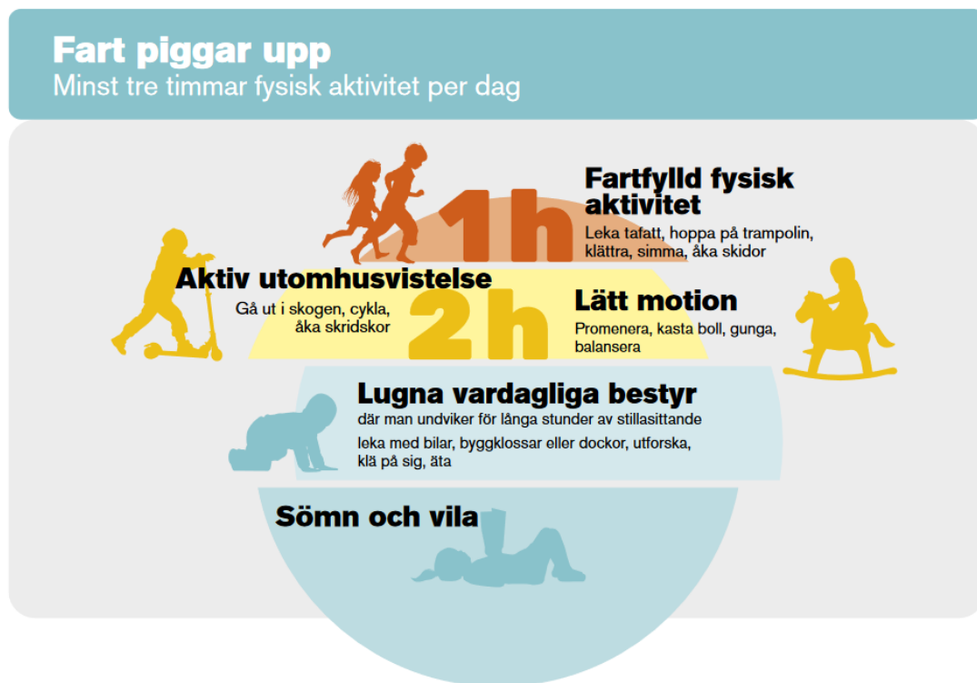
Bild 1. Den dagliga rekommenderade fysiska aktiviteten består av olika vardagssysslor av varierande intensitet under dagens lopp.

Fysisk aktivitet stöder barnets sunda växande och helhetsmässiga utveckling. För små barn är motion och fysisk aktivitet på samma sätt ett mänskligt behov som att äta eller sova. Enligt rekommendationerna om fysisk aktivitet under de första åren bör under 8-åriga barn vara fysiskt aktiva minst tre timmar varje dag. Den fysiska aktiviteten ska bestå av lätt aktivitet och rask utevistelse samt mycket fartfylld fysisk aktivitet. En del av den fysiska aktiviteten ska ske inom småbarnspedagogiken och en del hemma. Barn ska helst inte sitta stilla i mer än en timme och även under korta stunder av stillasittande behövs pauser. Fysisk aktivitet och en aktiv barndom minskar behovet av hälsovårdstjänster och de kostnader som tjänsterna orsakar. Fysisk aktivitet är till nytt för både individen och samhället. I rekommendationerna betonas även tillräcklig sömn och vila samt hälsosam kost. (Glädje, lek och gemensamma aktiviteter – Rekommendationer för fysisk aktivitet under de första åren, 2016)