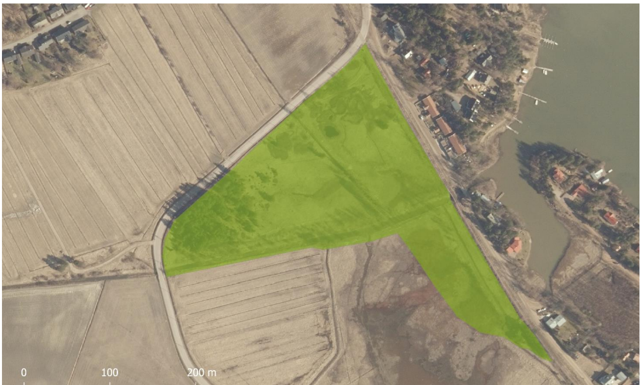
Kuva 3. Viitasammakon lisääntymis- ja levähdysalueen rajaus.