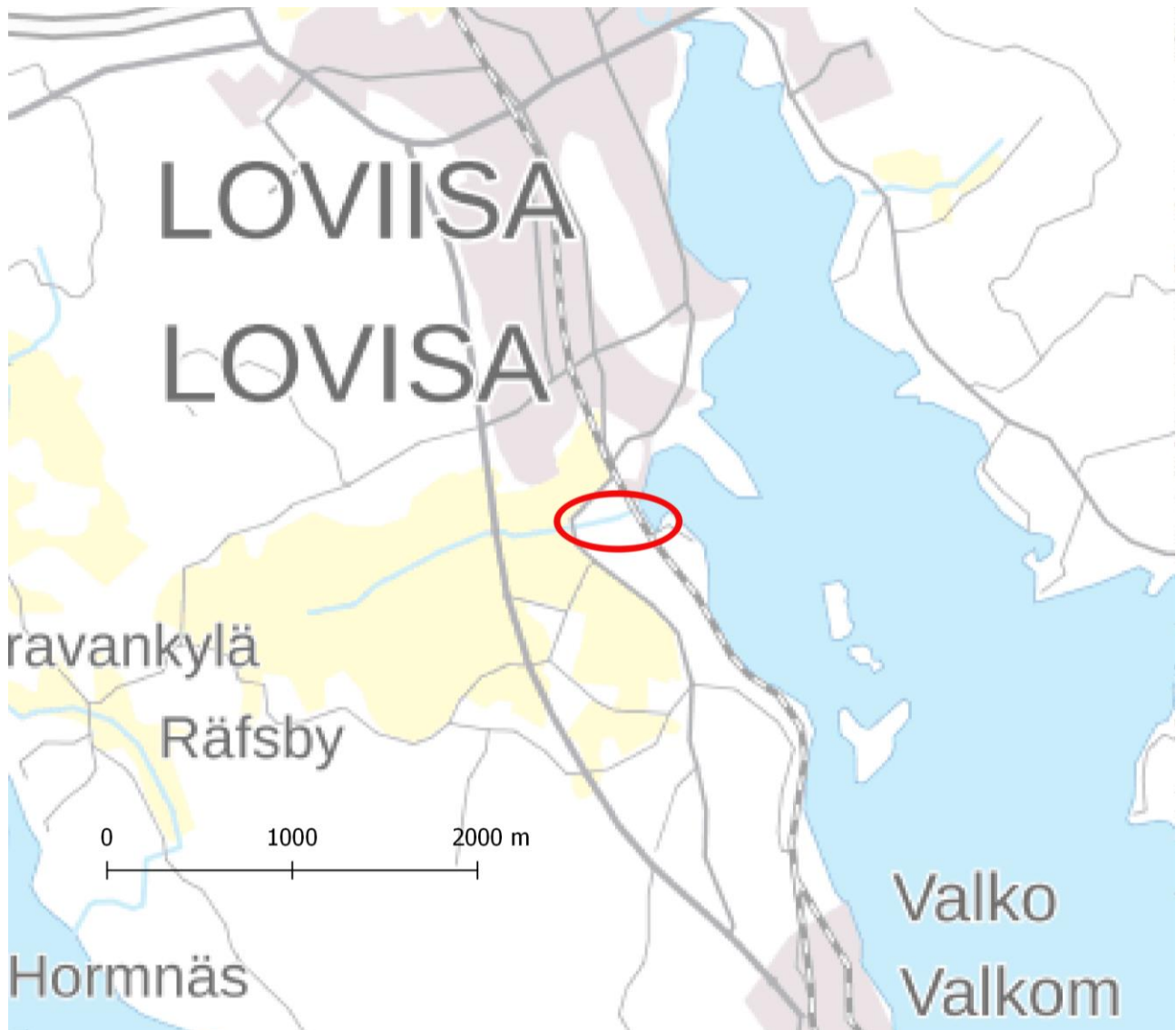
Kuva 1. Selvitysalueen sijainti. Pohjakartta: Maanmittauslaitoksen Taustakarttarasteri 1:80 000 6/2018. 3