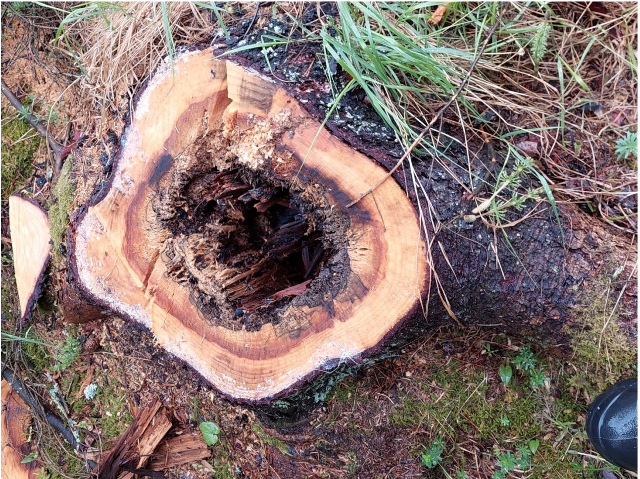
Bild 1 En rötangripen gran

”Granens rotröta är en rötskada som förekommer i växande granar och som sprids ut i stammen från rötterna. Rötan tar först över kärnveden vid stammens nedre del och fortsätter sedan så småningom högre upp och i mer omfattande grad i stammen. I slutskedet av sjukdomen börjar det rinna kåda ur stammen, toppen tappar barr och slutligen dör trädet, ofta till följd av attack av barkborrar. Vanligtvis faller dock vinden det rotröteangripna trädet redan innan det.” Luke