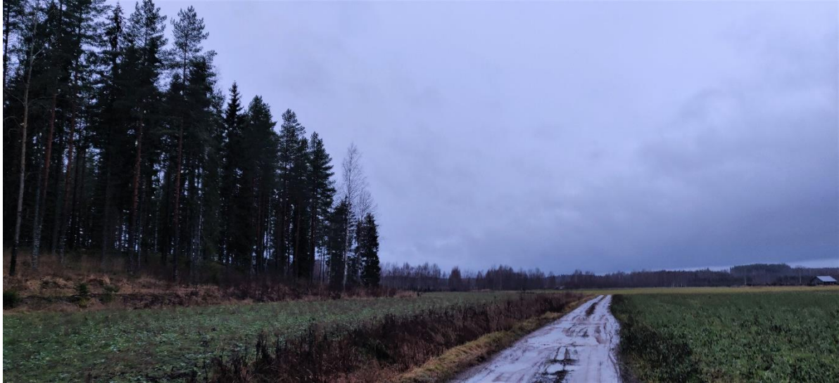
Figur 3-1 Åkern Träskängen i nordöstra delen av utredningsområdet 2021.

Området ligger främst på åkern Träskängen, som till största delen är odlad och vid kanterna är den dikad (figur 3-1). Vid åkerkanten finns barrträdsdominerad frisk gallringsskog. På området upptäcktes inga särskilda naturvärden.