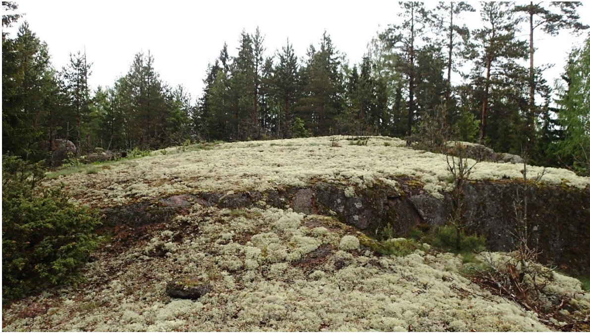
Figur 3-7. På området fanns klippor med ett glest trädbestånd samt rikligt med islandslav och fönsterlav 2021.