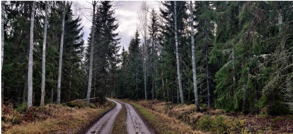
Figur 3-2. Grandominerade gallringsbestånd i nordvästra delen av utredningsområdet 2021.

På området finns ganska gammal grandominerad frisk blandskog där det också finns rikliga inslag av björk och gråal (figur 3-2). Bottenvegetationen består främst av växter som trivs på frodiga och lundartade områden och kärrförändringar såsom liljekonvalj, älggräs, olika gräsarter, skogs-näva och skogsfräken. Skogen har behandlats bland annat genom gallring och dikning och genom området löper en skogsbilväg. På området upptäcktes inga särskilda naturvärden.