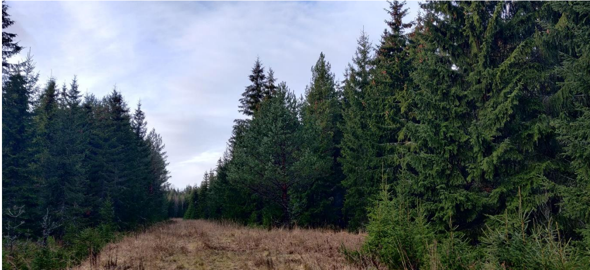
Figur 3-3. Vägsträckning och dikad, grandominerad ekonomiskog vid Gråstenskarret 2021.

På den planerade platsen för kraftverk T4 finns utöver det ängsartade området huvudsakligen kraftigt dikad ekonomiskog dominerad av i genomsnitt över 60-åriga granar. Det finns också inslag av björk och lövträdsplantbestånd, främst längs dikena. Växtligheten kring den nya kraftverksplatsen består delvis av torrlagt kärr och frisk mo. På området upptäcktes inga särskilda naturvärden. Tidpunkten för utredningsbesöket orsakar en viss osäkerhet i bedömningen.