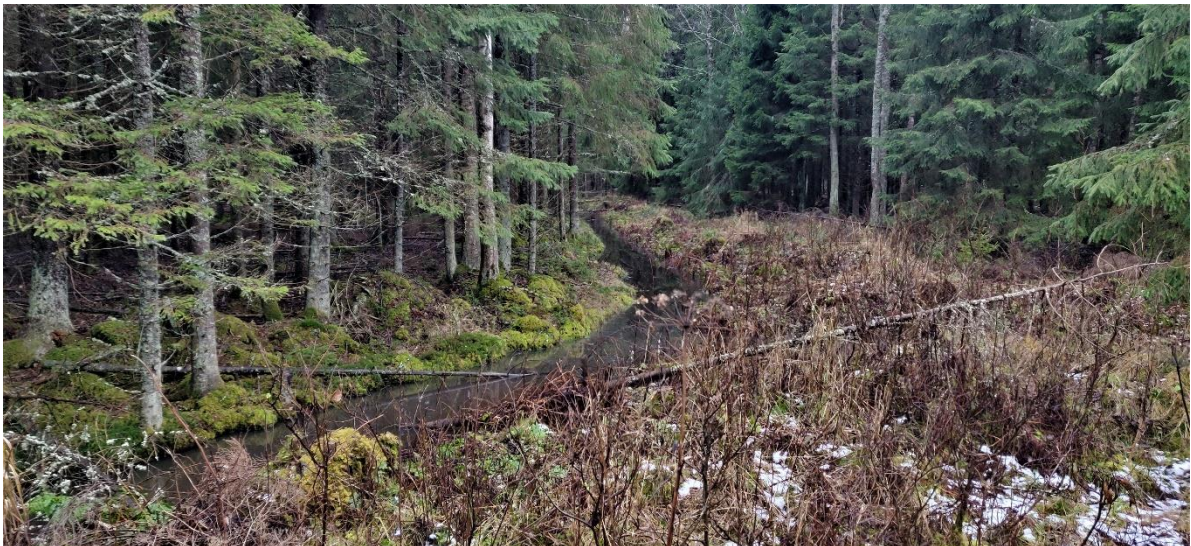
Figur 3-8. Mycket tät och dikad ekonomiskog med många unga murkande träd på marken.

Området som har bearbetats genom skogsbruk består av fuktig samt mycket tät kärrartad gran-skog. Trädbeståndet är i genomsnitt över 60-årigt och det finns ung och tät underväxt. På området finns ganska breda dikningar. Vid figurens östra och södra kant finns ett ganska ungt och kraftigt gallrat tallbestånd. De bortgallrade stammarna har tills vidare lämnats kvar i skogen och området är ställvis ganska stenigt. På området upptäcktes inga särskilda naturvärden.