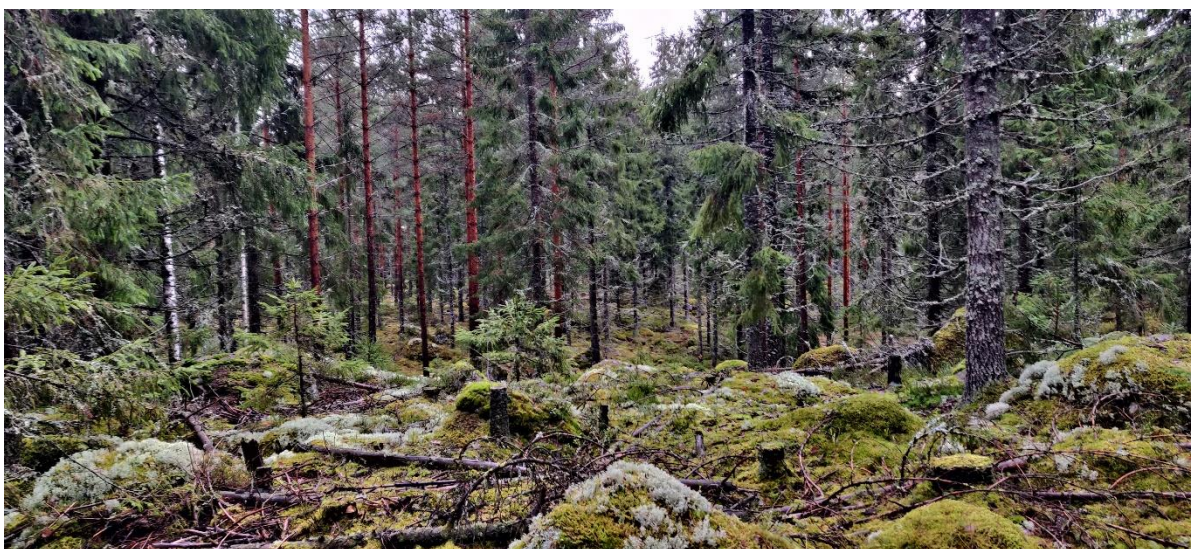
Kuva 3-6. Kraftigt behandlad grandominerad blandskog 2021.

På området förekommer dessutom öppna klippmarker med ett glest trädbestånd. Där består växtligheten främst av islandslav och fönsterlav (figur 3-7). Vid klippområdets kanter är trädbeståndet ungt och behandlat genom skogsbruksåtgärder, och där finns inga murkna träd eller tvinvuxna tallar som är typiska för klippområden i naturtillstånd. På grund av att naturtillståndet är ändrat kan klippområdet inte anses vara en sådan särskilt värdefull livsmiljö som avses i 10 § i skogslagen. I områdets östra del övergår klippområdet till ett lundartat område där det växer speciellt mycket liljekonvalj och örnbräken samt några unga skogslindar. På grund av det ringa antalet skogslindar och skogsbruksåtgärderna på området uppfyller området inte kriterierna för en skyddad naturtyp enligt 29 § i naturvårdslagen.