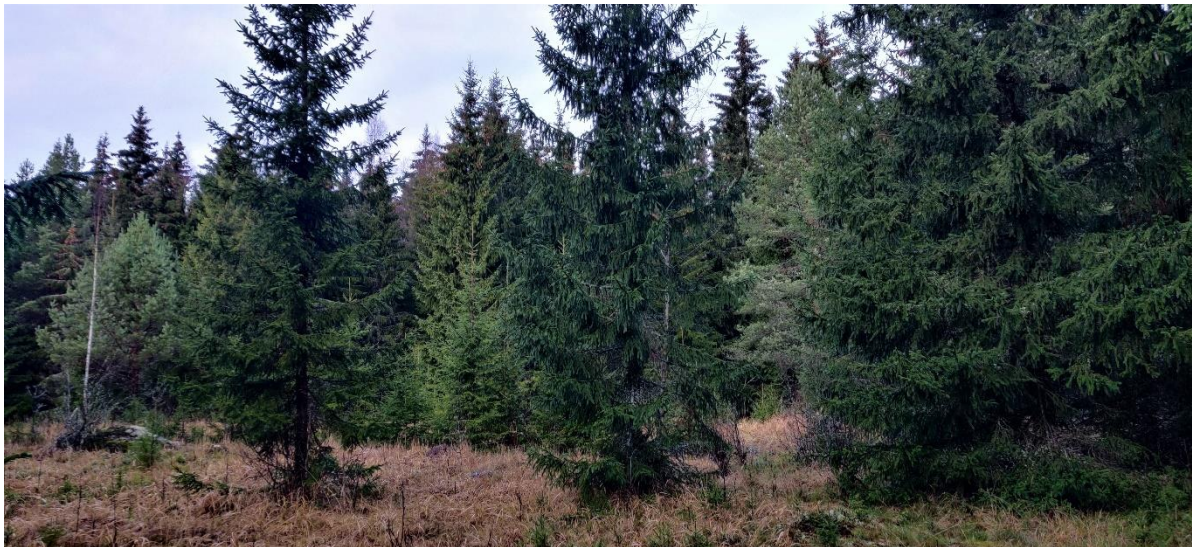
Figur 3-4. Ängsartad växtlighet och ganska ungt granbestånd vid den nya platsen för kraftverk T4.