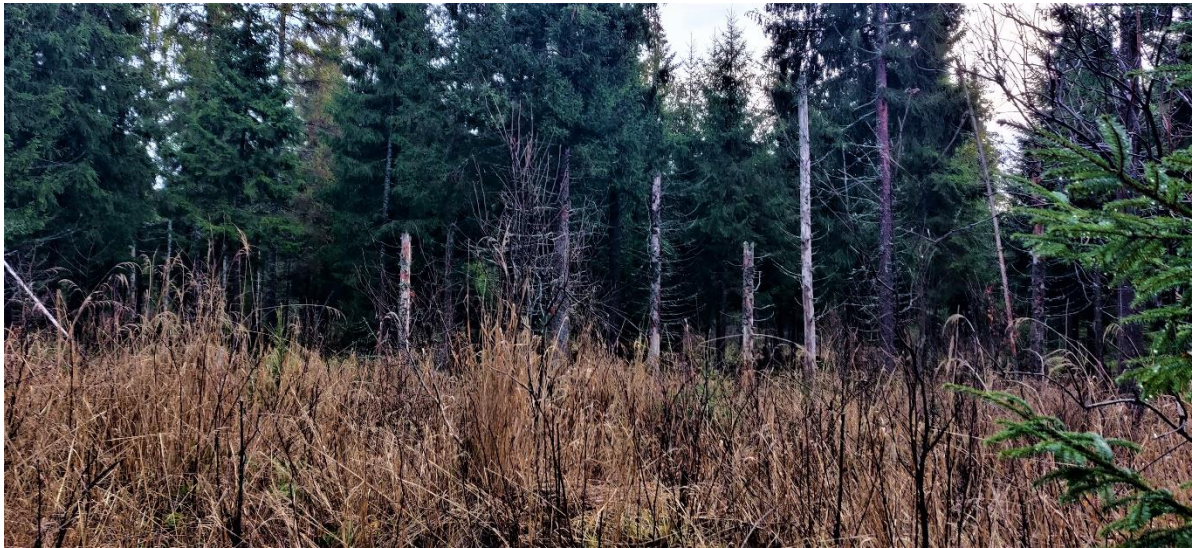
Figur 3-5. Stående murkna träd på området där den nya kraftverksplatsen T4 finns.