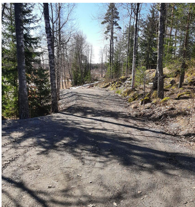
Bild 15. Väginfarten till byggplats 2 mot söder, vägen södra del finns avbildad på bild 5.