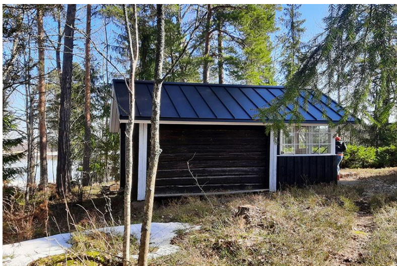
Bild 12. Lidret öster om stugan på byggplats 2.