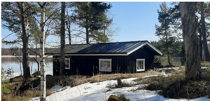
Bild 13. Båthuset på den nordöstra udden på byggplats 2.