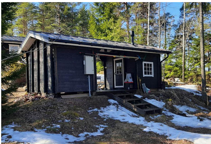
Bild 11. Lidret norr om stugan på byggplats 2.