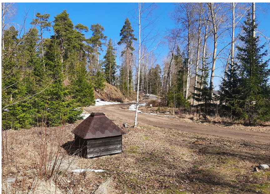
Bild 5. Infartsvägen till byggplats 2 längs den östra stranden av Storholmen.