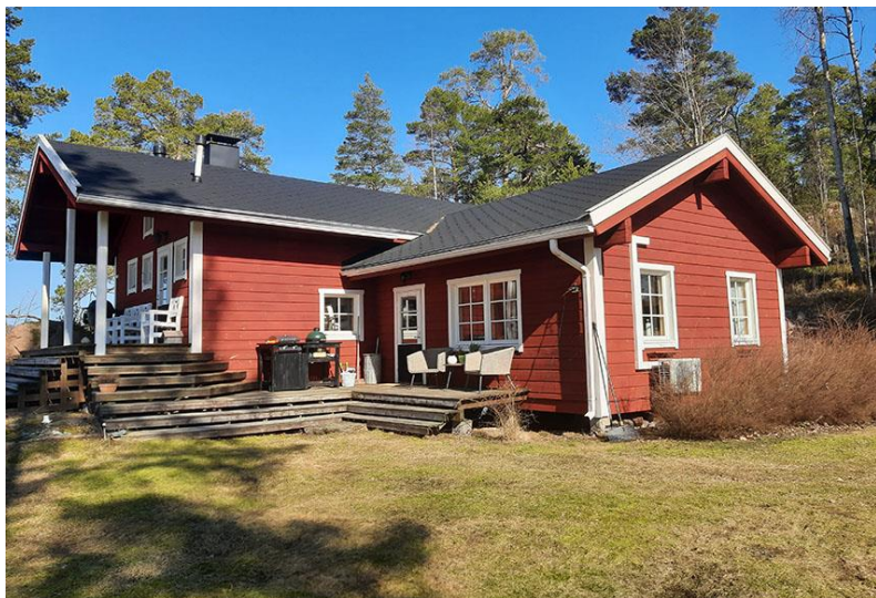
Bild 1. Fritidsstugan på byggplats 1.