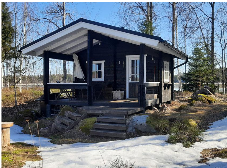
Bild 10. Bastun på byggplats 2.