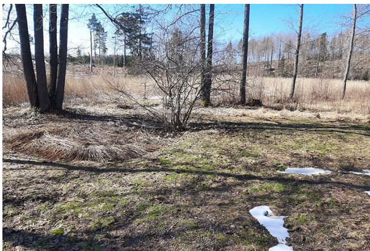
Bild 7. MY-1 området söder om byggplats 1.