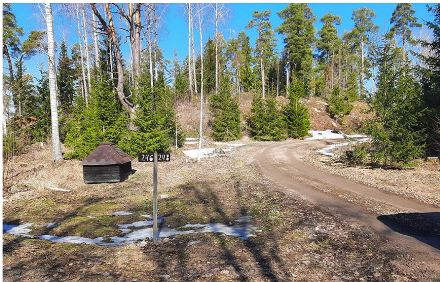
Bild 4. Byggnadsytan på kullen på byggplats 1 avbildad från söder vid infartsvägen.