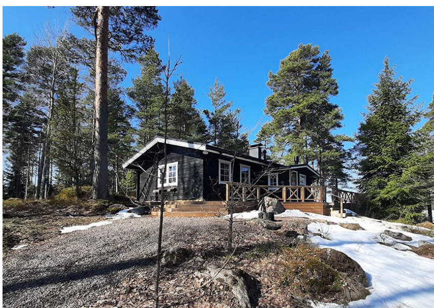
Bild 9. Fritidsstugan på byggplats 2.