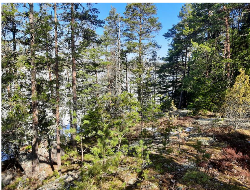
Bild 3. Strandvegetationen norr om stugan på byggplats 1.