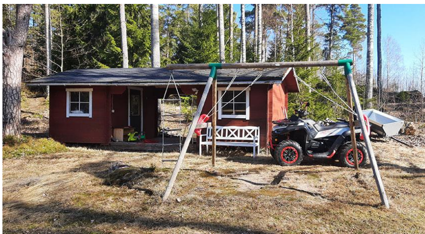
Bild 2. Lidret på byggplats 1.