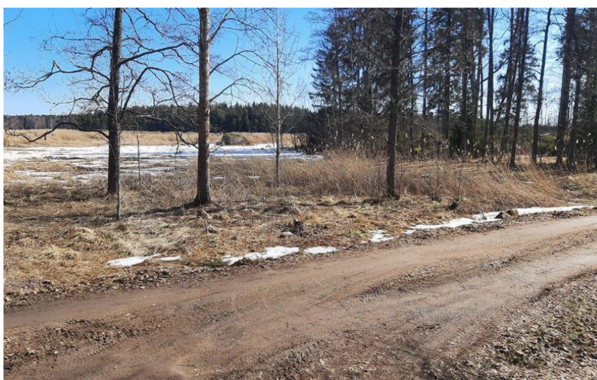
Bild 8. MY-1 området i sydost.