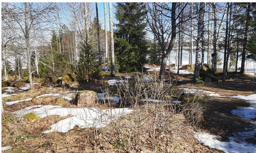
Bild 14. Terrängen på gårdstunet i det inre av den norra udden av byggplats 2. Bakom trädbeståndet ligger bastun.