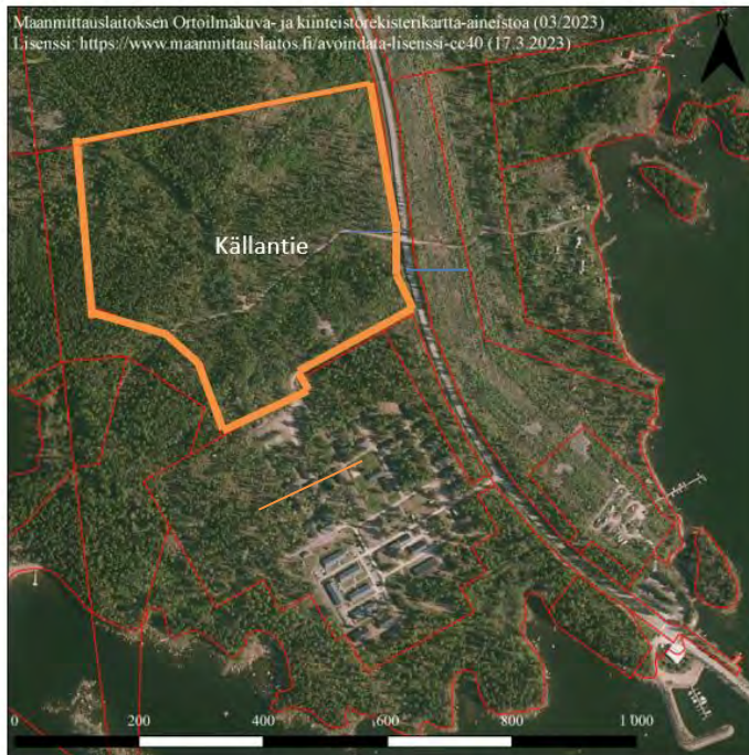
Kuva 1. Fortumin kiinteistö, jolle vedyntuotannon pilottilaitosta suunnitellaan.