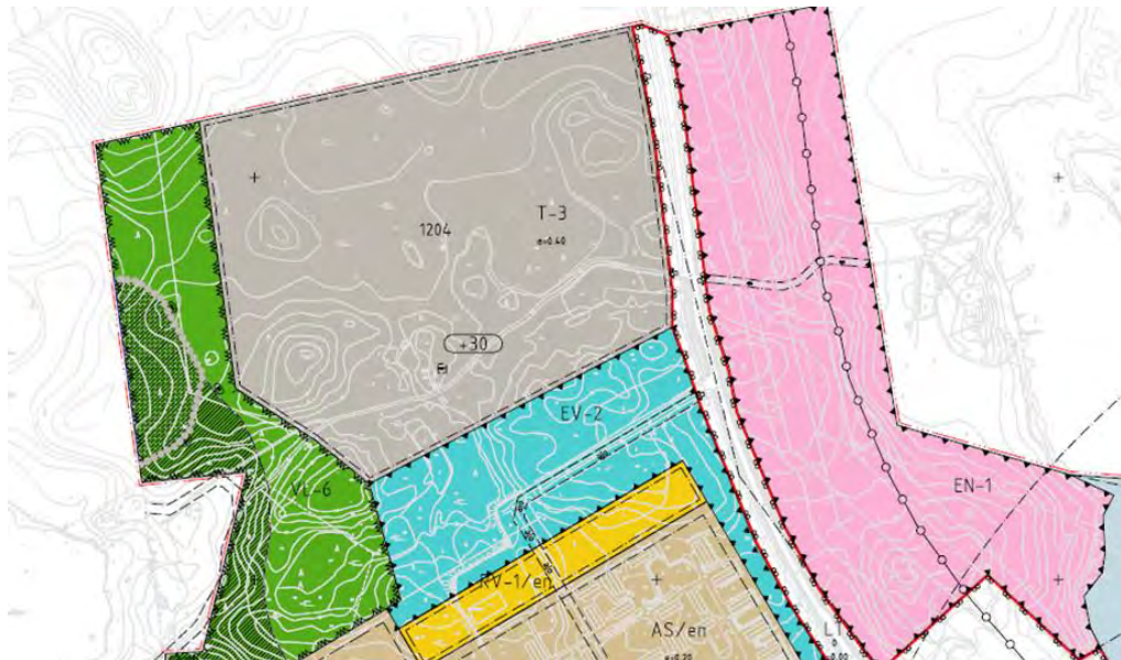
Kuva 2. Ote voimassaolevasta asemakaavasta.

Asemapiirros alueesta on esitetty kuvassa 3. Kiinteistöä halkoo Källan leirikeskukseen menevä tie (Källantie), jonka linjaukseen tulee pilotin myötä muutoksia. Alustavasti on suunniteltu, että nykyinen Källantie palvelisi pilottihanketta ja muille tien käyttäjille tehtäisiin uusi tielinjaus, joka kiertäisi pilottihankkeen ja palaisi tämän jälkeen takaisi Källantielle. Uusi tielinjaus tehtäisiin Fortumin omistamalle hankekiinteistölle. Vetylaitoksen tuotantotilat eivät ulottuisi Källantien eteläpuolelle.