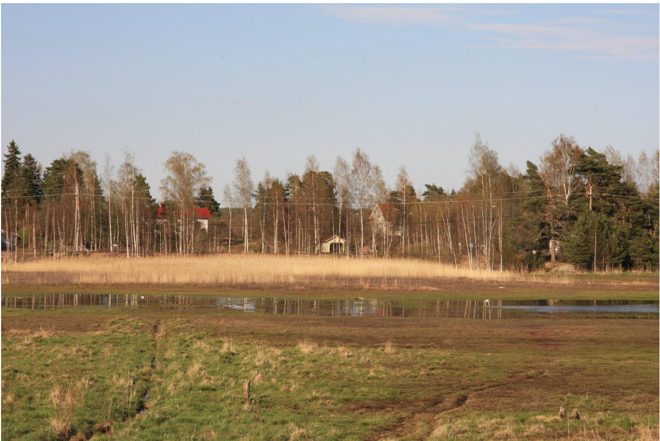
Kuva 3. Lillängarnan kosteikon tulvaniittyä.

Viitasammakkoa ei todettu yhdestäkään merenlahdesta, joista varsinkin Braskviken ja Hemviken tarjoavat kutualueeksi sopivalta vaikuttavan, suojaosan ja reheväkasvuisen ympäristön. Braskvikenin pohjoispuolella selvityksen kanssa 29.4. ja 2.5. samaan aikaan meneillään olleet metsänhakuut ovat voineet vaikuttaa havaintojen puuttumiseen. Metsäkoneet jylläsivät tällöin vielä klo 23 ja 24 välillä. Hakkuuaukko ulottui lähimmillään noin 30 metrin päähän Braskvikenin rannasta. Hemviken ja Braskviken pystyttiin tarkistamaan hakkuiden tauottua 5.5., jolloin viitasammakkokoiraat jatkoivat lauluaan Valkolammella. Toimenpiteillä on ollut todennäköisesti vähintään heikentävä vaikutus viitasammakon lisääntymismahdollisuuksiin läheisissä merenlahdissa. Viitasammakot häiriintyvät helposti (Jokinen 2012). Mikäli viitasammakolla on elinaluetta em. selvitysalueen rantaosuudella, hakuut ovat voineet paitsi häiritä soidinmenoja ja kutua, myös haitata niiden vaellusta kutualueelle.