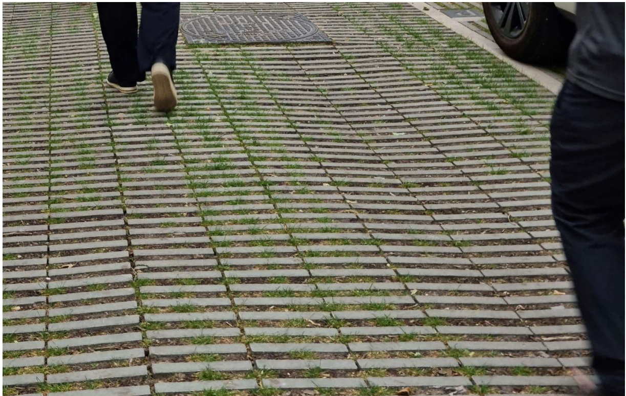
Kuva 3, esimerkki juuristoystävällisestä katupäällysteestä Antwerpenissa, Belgiassa. Kuvattu alue on parkkipaikka, jonka reunoilla kasvaa suuria puita.

Myös maankaivutyö säilytettävien puiden juuristoalueella voidaan suorittaa ilmalapion avulla, jolloin juuret eivät katkea rakennustyön yhteydessä. Juuristoalueen päällystemateriaaliksi on suositeltavaa valita asfaltin sijaan jokin muu, juuristoystävällisempi vaihtoehto.